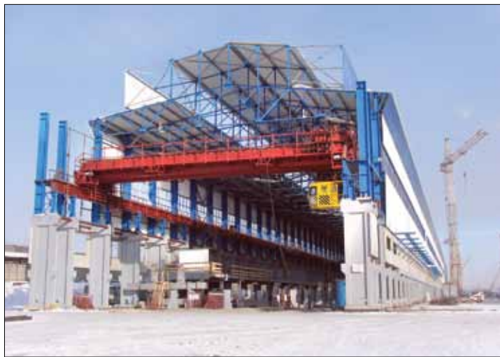
Пятая серия ИркАЗа

связи «БВК» и «МТС», участие в строительстве и реконструкции объектов АНХК, объекты Министерства обороны РФ, восстановление после аварии здания на Саяно-Шушенской ГЭС, два корпуса Дальневосточного федерального университета на острове Русский во Владивостоке.