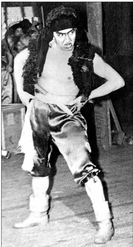
В роли Бармалея

Крылатые выражения, автором которых является Михаил Филиппович, в Ангарске окрестили «бачинизмами». Вот некоторые из них: