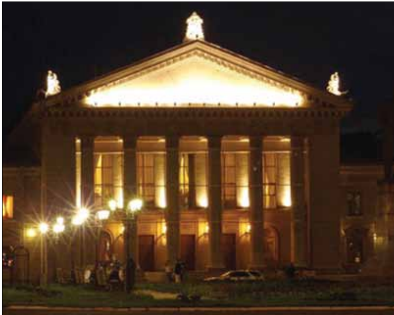
Здание ДК «Нефтехимик» – украшение главной площади города