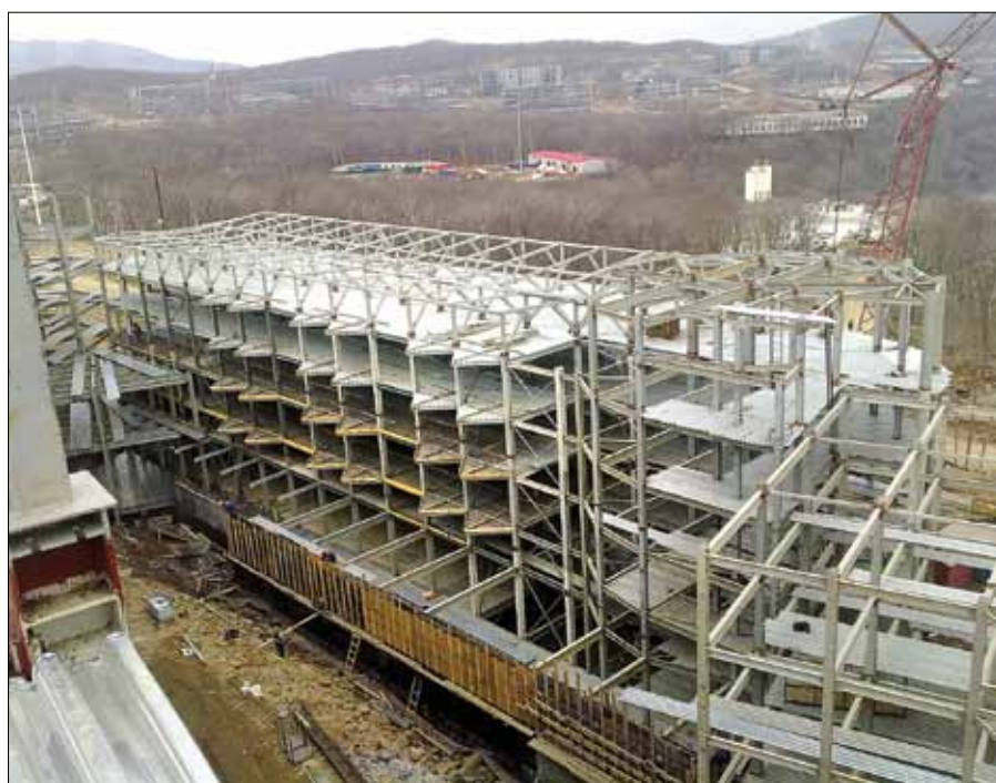
Корпус ДВФУ на о. Русский, г. Владивосток

За последние пять лет было отработано 10 наиболее значимых объектов. Это строительство объектов пятой серии Иркутского алюминиевого завода, угольно-обогащительная фабрика в поселке Саган-Нур в Бурятии (заказчик СУЭК), терминально-складской комплекс ВСЖД, объекты первой очереди ВСТО в Якутии, новый пивзавод «САН ИнБев» в Ангарске, телебашня высотой 150 м в Иркутске для компании «АС Байкал ТВ», металлоконструкции башен сотовой