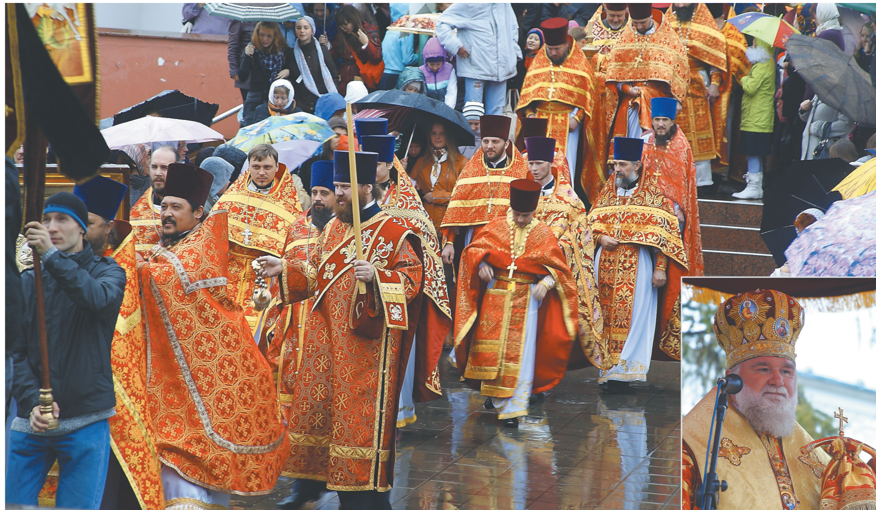
Крестный ход, приуроченный к открытию традиционного фестиваля «Сияние России»

По окончании богослужения в селе Качуг митрополит Вадим и гости прихода посетили село Анга, — малую родину митрополита Иннокентия, где в стенах возрождающегося храма также был отслужен молебен святому угоднику Божьему Иннокентию Вениаминову просветителю Сибири, Аляски и Америки. ■