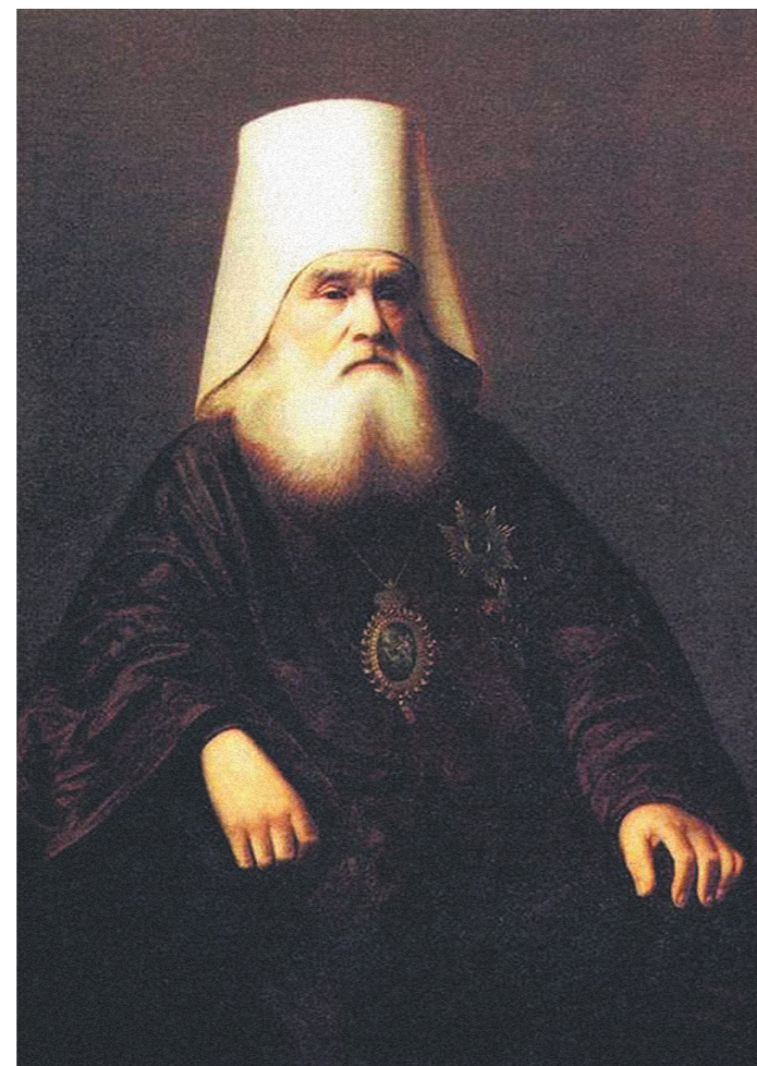
Святитель Иннокентий Иркутский