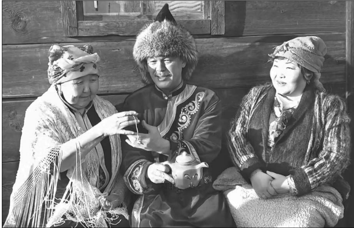
Кадр из фильма «Болзорой зугаа»