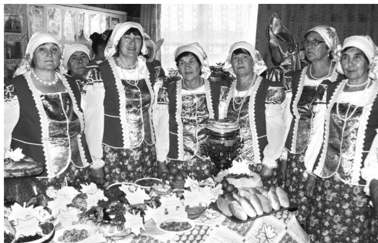
Ансамбль «Рябинушка» из МО Забитуй Аларского района

На нарядные скатерти как будто сошли яркие лубочные картинки – сверкающие самовары, увешанные баранками, румяные караваи и пироги. А стол коллектива «Чистые ключи» из Александровского украшен кра-