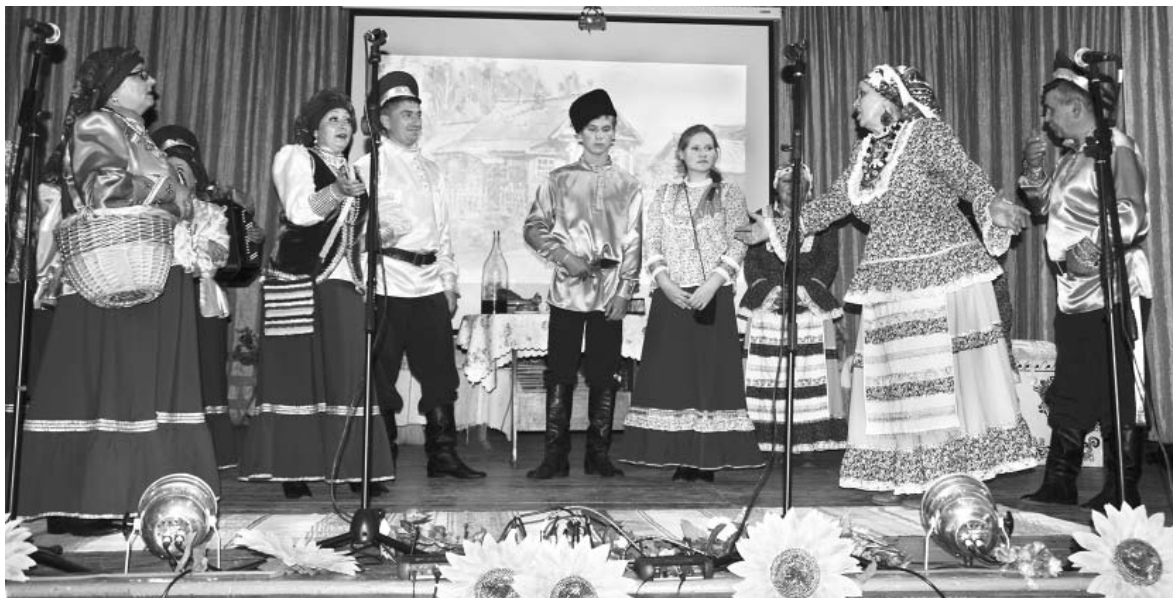
Ансамбль «Казачка», обряд сватовства