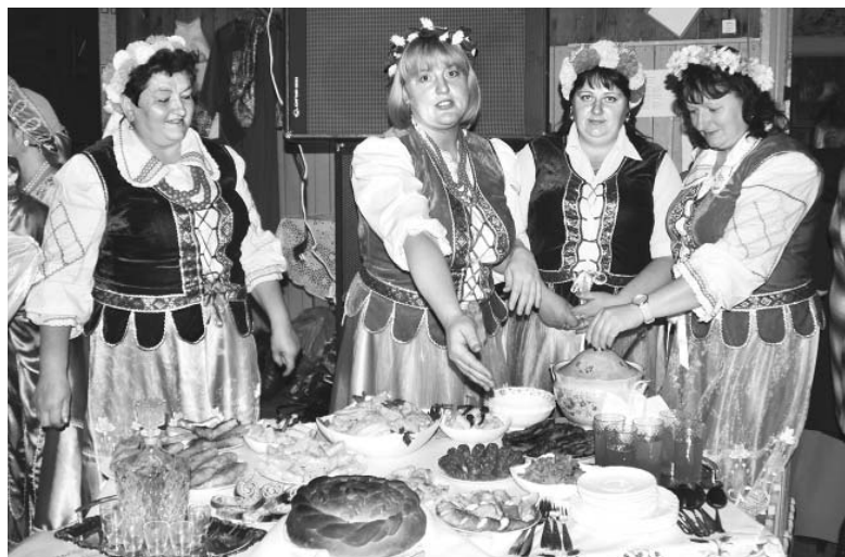
Участницы ансамбля «Яжумбэк»: «Попробуйте, это вкусно!»