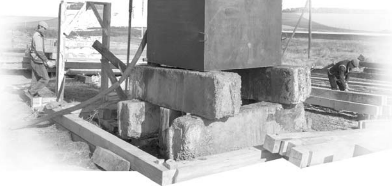
На днях в Идеале запустили в строй водокачку

Общими усилиями администрация и жители сохранили три малокомплектные школы – в Куйте, Заречном и в Малолучинске. В Аршане школу все же пришлось закрыть – из-за ветхости здания. А вот для детсада в Идеале, который был в аварийном состоянии, нашли помещение. От бывшего местного совхоза осталась контора, которой власти муниципалитета решили дать новую жизнь. Район купил ее за 200 тыс. рублей, а местные мужики методом народной стройки провели в здании ремонт. Теперь в обновленном детсаду, рассчитанном на 50 детей, работают две группы.