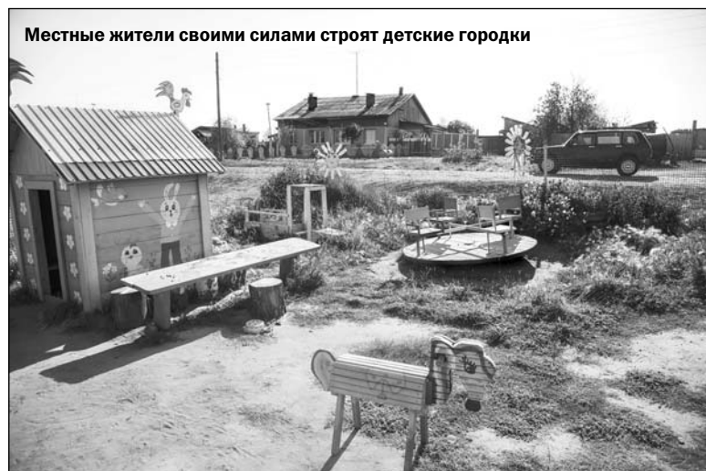
Местные жители своими силами строят детские городки

Людмила ШАГУНОВА