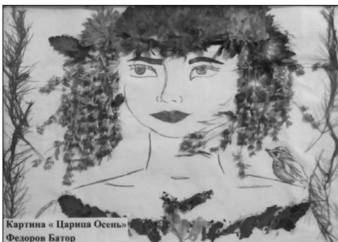
Картина «Царица Осень» Федоров Батор

Два года подряд Ныгдинский детский сад занимает призовые места в конкурсе на лучшее дошкольное учреждение года.