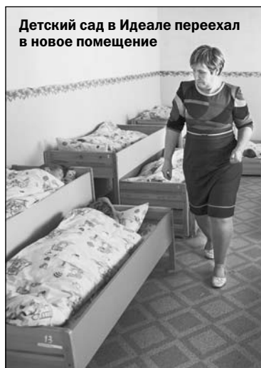
Детский сад в Идеале переехал в новое помещение