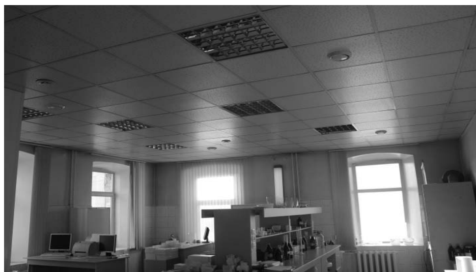
Фото А.А. Жильцов, январь 2019 г. Интерьер в пом. № 23 (по плану МУП «БТИ г. Иркутска» от 29 марта 2011 года) на 2 этаже.