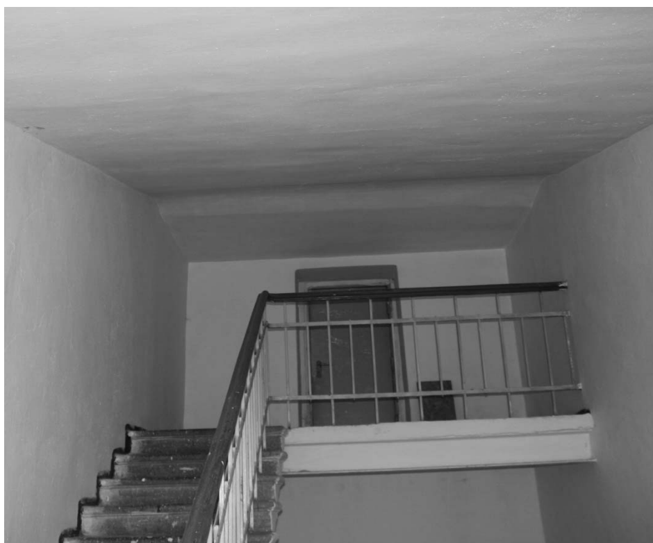
Фото А.А. Жильцов, январь 2019 г. Фрагмент лестницы, вид на дверь в чердачное помещение.