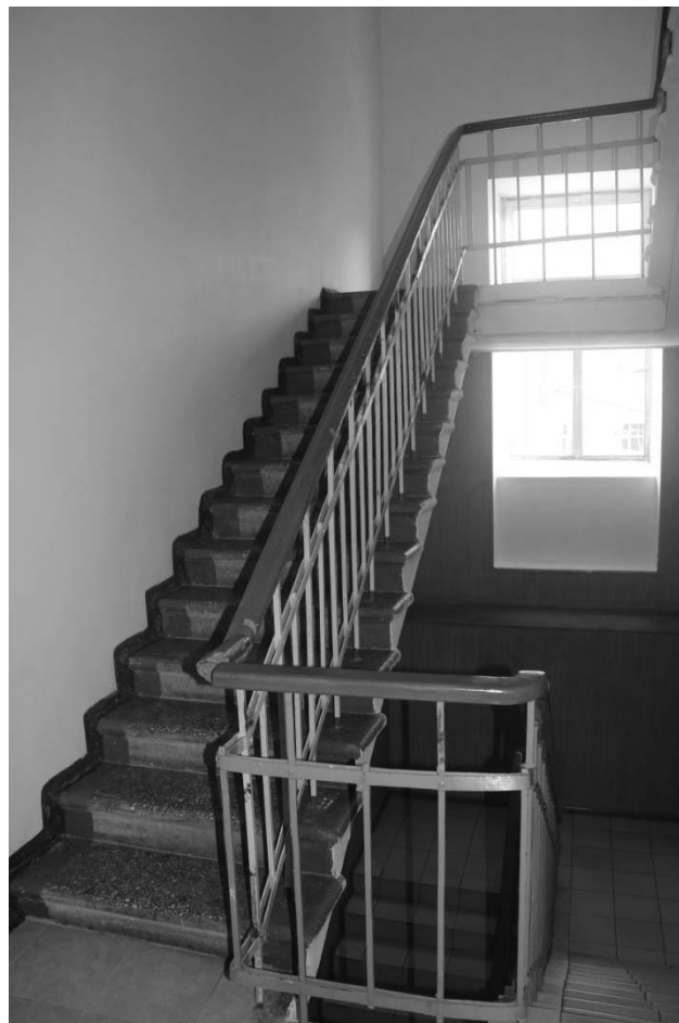
Фото А.А. Жильцов, январь 2019 г. Фрагмент лестницы.