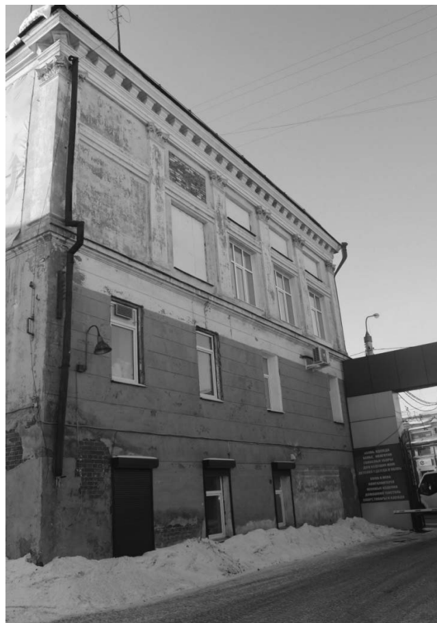
Фото А.А. Жильцов, январь 2019 г. Боковой (северо-восточный) фасад.