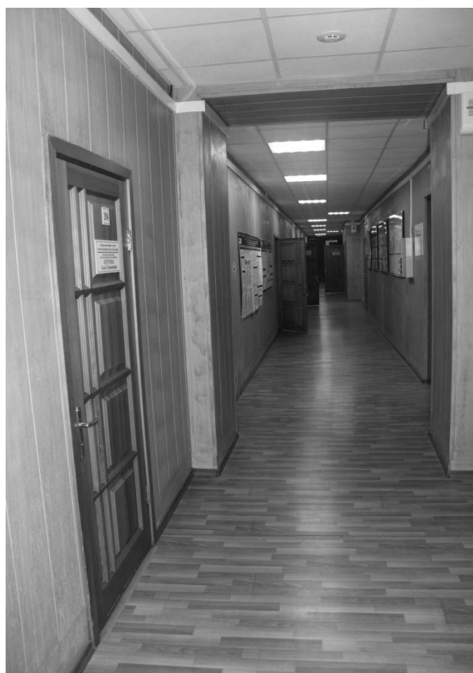
январь 2019 г. Коридор на втором этаже.