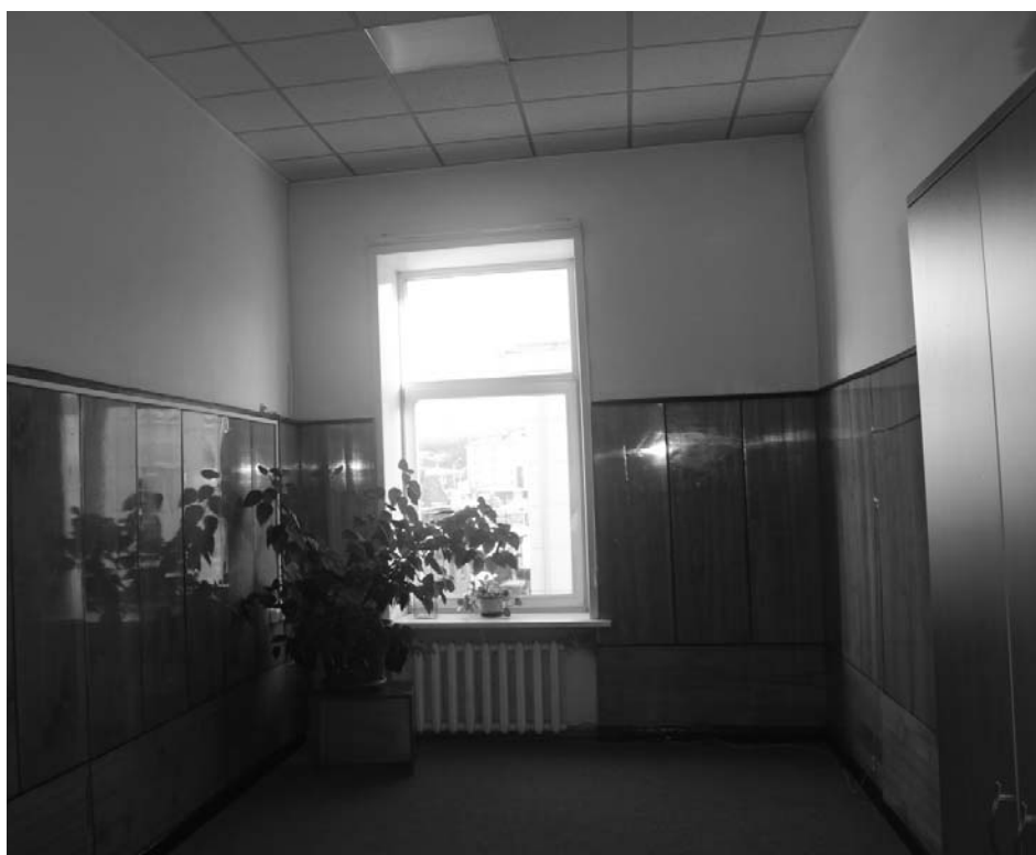
Фото А.А. Жильцов, январь 2019 г. Интерьер в пом. № 8 (по плану МУП «БТИ г. Иркутска» от 29 марта 2011 года) на 3 этаже.