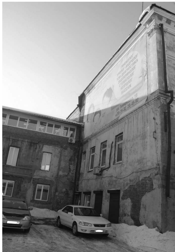
Фото А.А. Жильцов, январь 2019 г. Фрагмент дворового (юго-восточного) фасада.