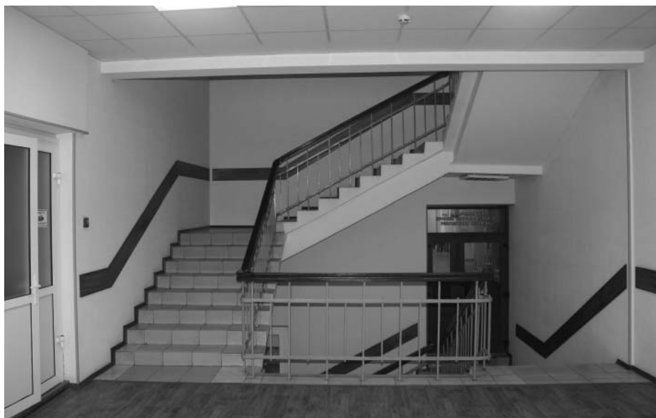
январь 2019 г. Вид на главную лестницу со второго этажа.