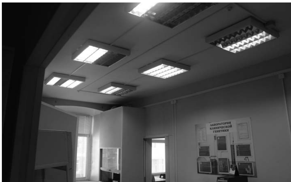
январь 2019 г. Интерьер в пом. № 16 (по плану МУП «БТИ г. Иркутск» от 29 марта 2011 года) на 2 этаже.