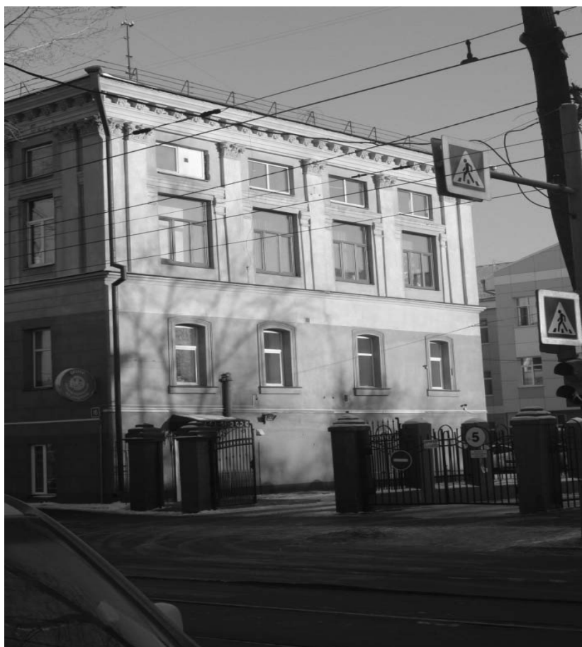
Фото А.А. Жильцов, январь 2019 г. Боковой (юго-западный) фасад.