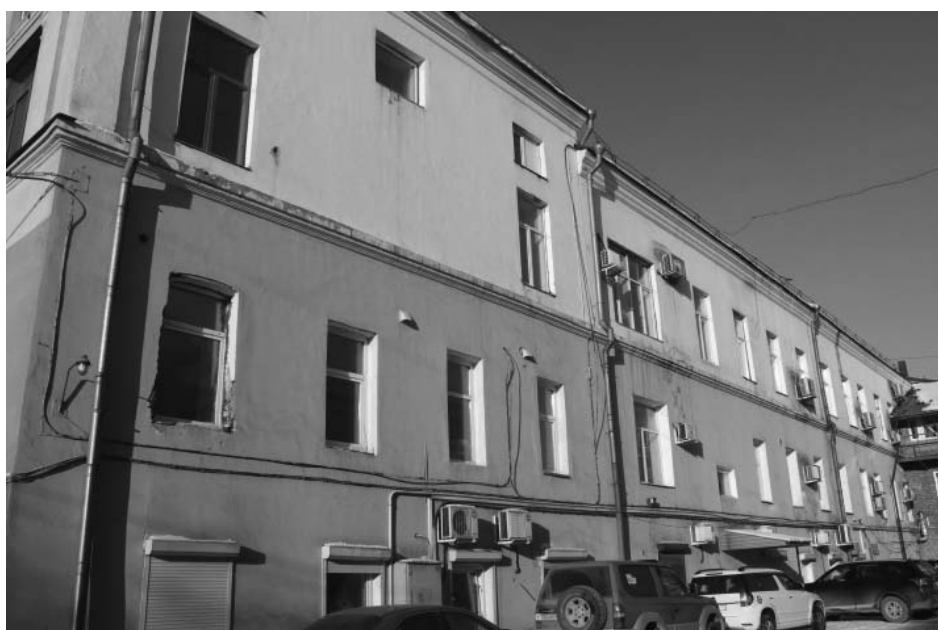
январь 2019 г. Дворовый (юго-восточный) фасад.