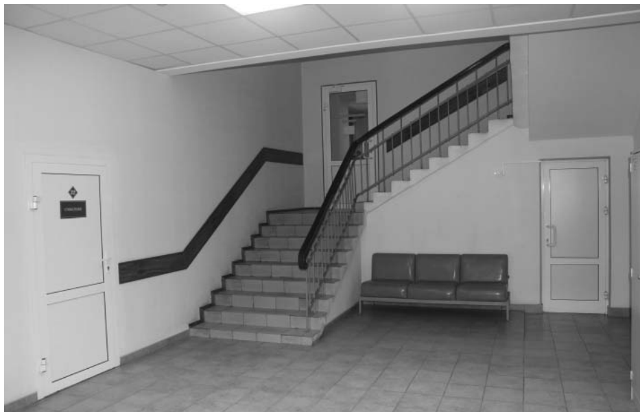
Фото А.А. Жильцов, январь 2019 г. Вид на главную лестницу с первого этажа.