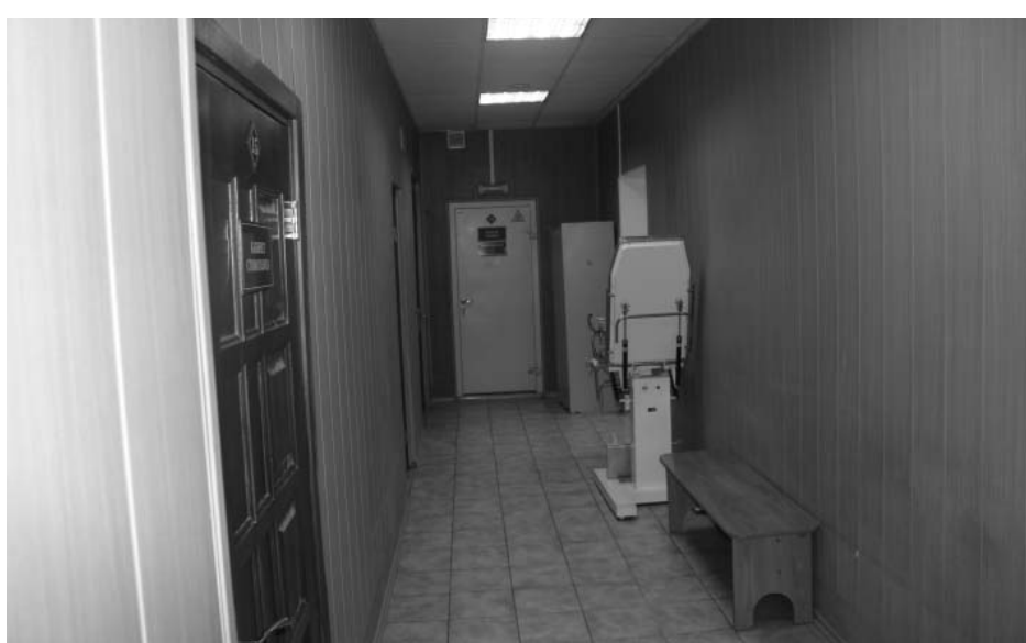
Фото А.А. Жильцов, январь 2019 г. Коридор (пом. № 64 по плану МУП «БТИ г. Иркутск» от 29 марта 2011 года) на 1 этаже.