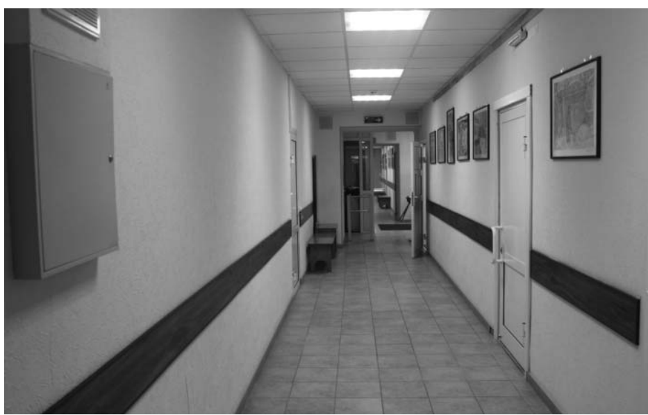
Фото А.А. Жильцов, январь 2019 г. Коридор (пом. № 66 по плану МУП «БТИ г. Иркутск» от 29 марта 2011 года) на 1 этаже.