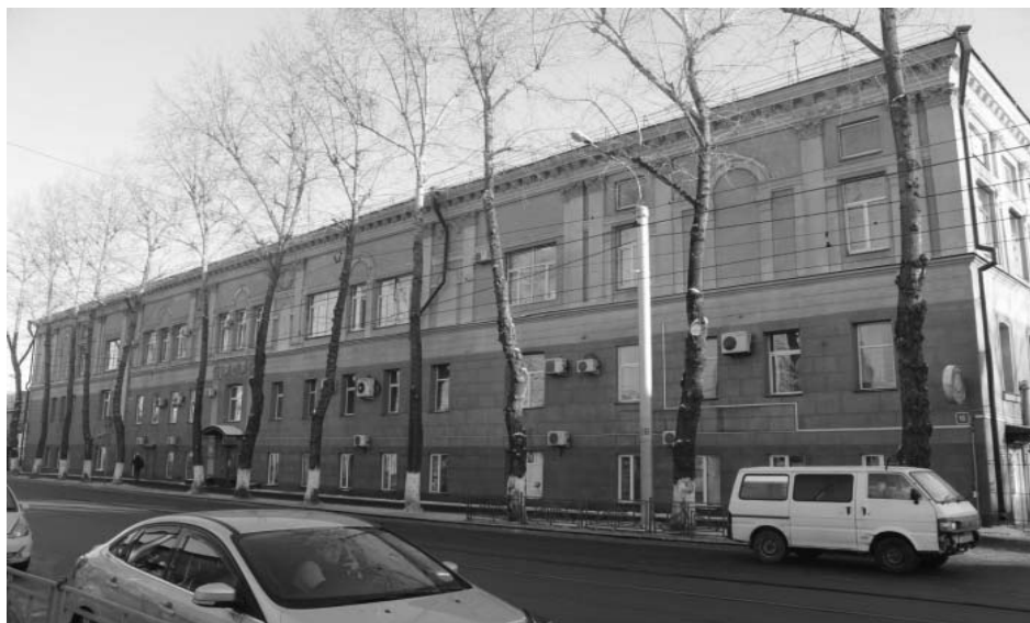
Фото А.А. Жильцов, январь 2019 г. Главный (северо-западный) фасад.

Приложение к охранному обязательству собственника или иного законного владельца Фотографическое изображение объекта культурного наследия регионального значения «Дом, в котором в 1920-х годах находился Иркутский штаб ЧОН», кон. XIX в., расположенного по адресу: г. Иркутск, ул. Тимирязева, 16 (на момент утверждения охранного обязательства) на 9 листах.