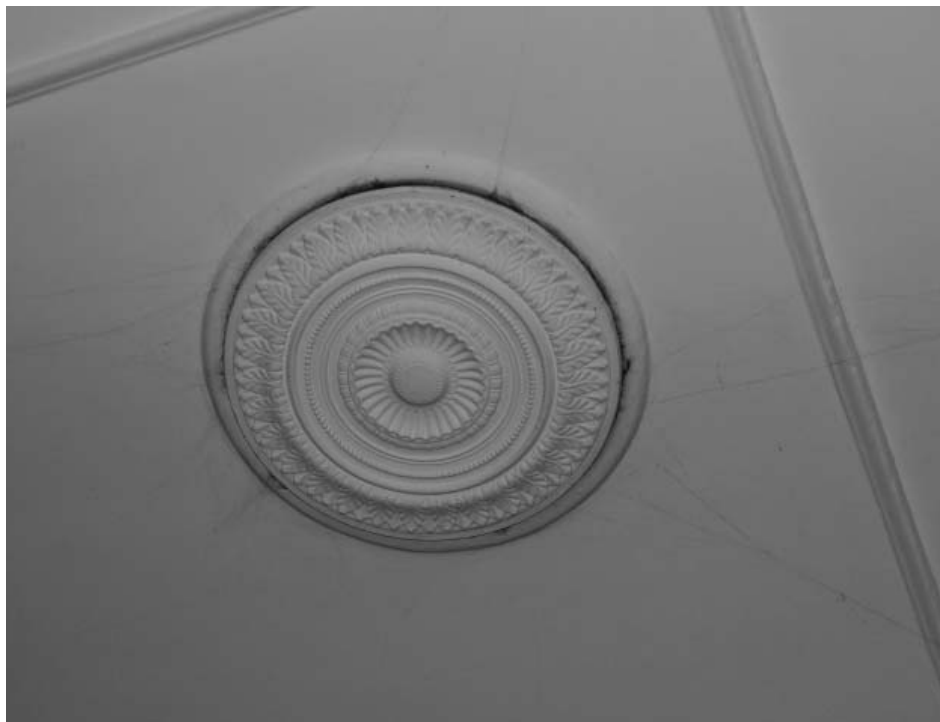
Фото А.А. Жильцов, январь 2019 г. Одна из четырех потолочных розеток в пом. № 1 (по плану МУП «БТИ г. Иркутска» от 29 марта 2011 года) на 3 этаже.