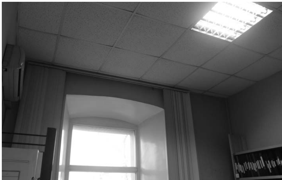
Фото А.А. Жильцов, январь 2019 г. Интерьер в пом. № 31 (по плану МУП «БТИ г. Иркутск» от 29 марта 2011 года) на 2 этаже.