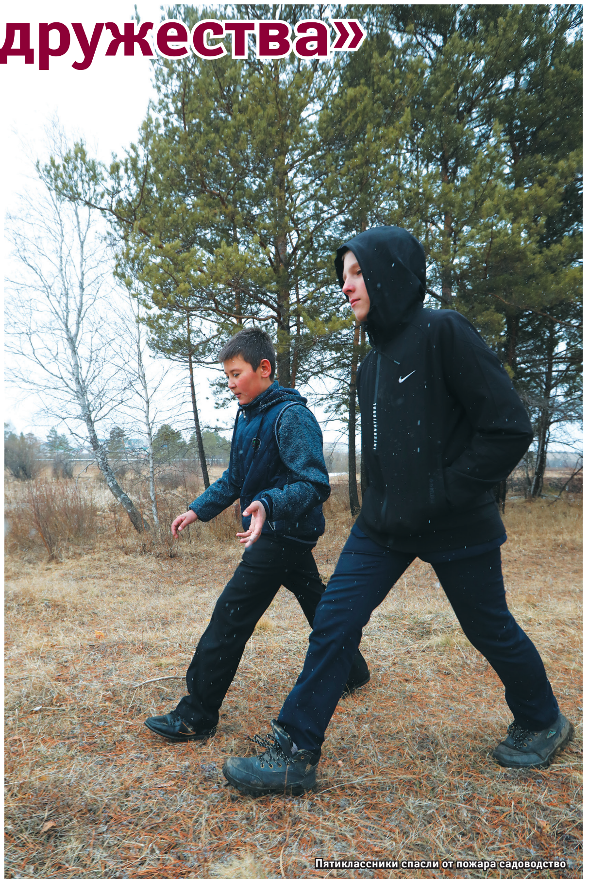
Пятиклассники спасли от пожара садоводство

– Не скрою, было приятно, но я совершенно не удивилась такому его поступку. Сын с раннего детства очень ответственный и неравнодушный мальчик. Уже несколько раз тушил мелкие пожары. Возле деревянного мостика, который соединяет садоводство с Маркова, периодически горит трава, и они уже раза три с младшим семилетним братом ее тушили. Брали бутылки с водой и просто заливали.