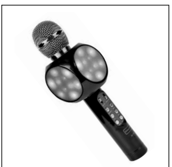
Карaoke-микрофон беспроводной AtomKM-1100L (FM, TF, USB)