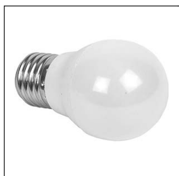
Лампа светод. E27 LED 3.5W ASD 4000K