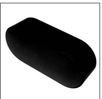
Колонка Bluetooth Y37