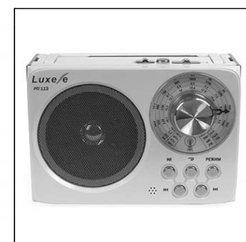
Радиоприемник Luxele РР-113 FM 64-108МГц