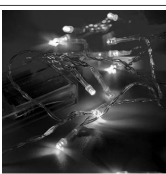
Гирлянда светодиодная рисовая 3М, мульти (4 цв)