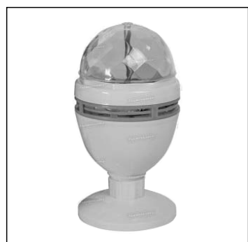
Светодиодная система B52 3Вт, на подставке