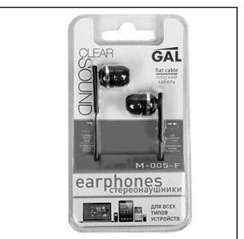
Наушники вкладыши M-005-F GAL черные