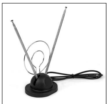
Антенна комнатная ДМВ+МВ усы 1м кабель 1м