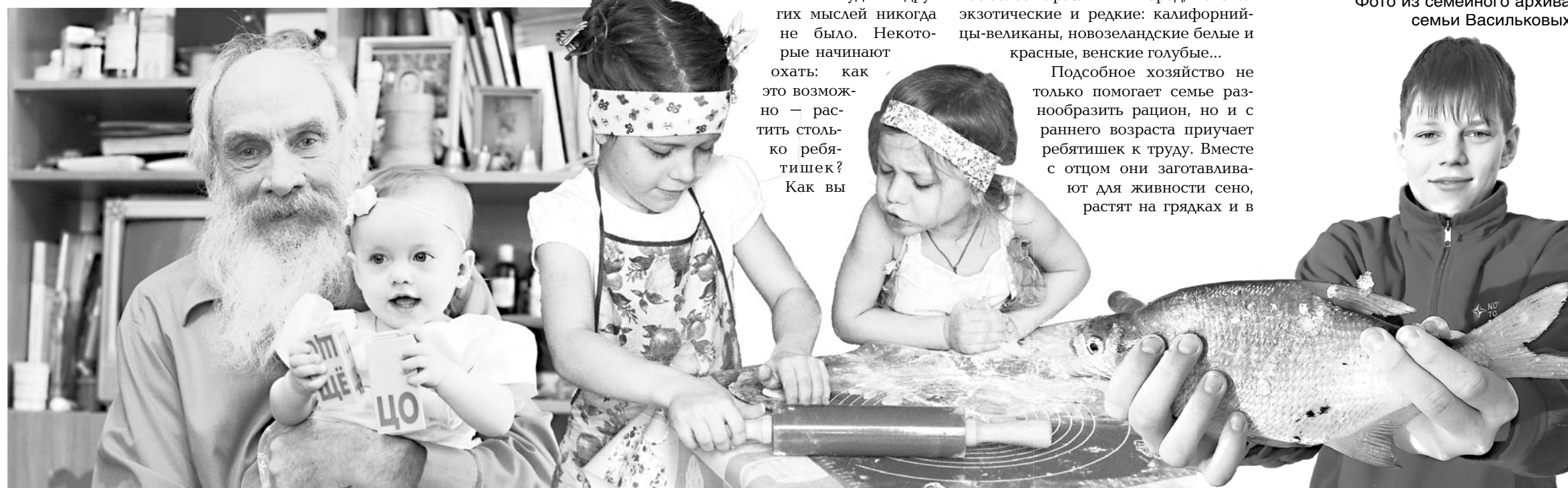
Анна ВИГОВСКАЯ

Глядя, как у увлекшихся рассказами супругов горят глаза, невольно захотелось тоже присоединиться к мнению их друзей и сказать — счастливые!