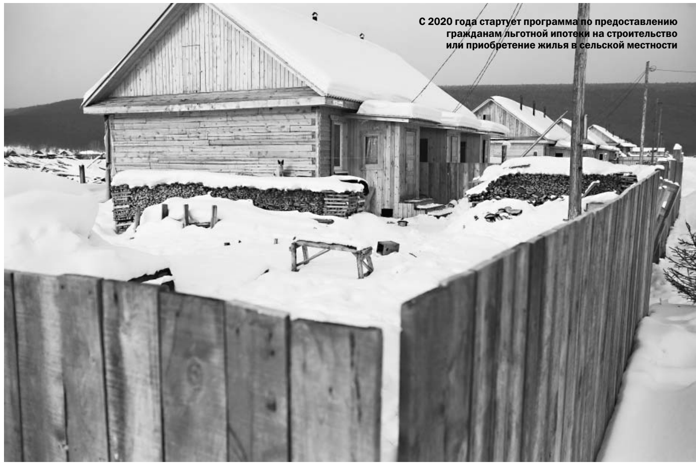
С 2020 года стартует программа по предоставлению гражданам льготной ипотеки на строительство или приобретение жилья в сельской местности