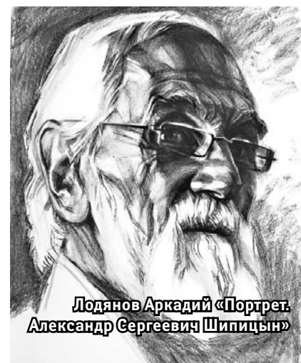
Лодянов Аркадий «Портрет. Александр Сергеевич Шпицын»

Победителя конкурса-выставки «Лучшее произведение изобразительного искусства» определят сами участники путем голосования. Лауреаты получат денежные призы и почетные знаки отличия от партнеров, а также возможность провести персональную выставку на одной из экспозиционных площадок Иркутска. Торжественное закрытие, на котором подведут итоги конкурса-выставки и наградят победителей, состоится 16 апреля в 17.00 в студенческом культурно-досуговом центре «Художественный».