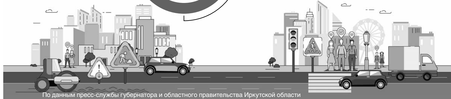
По данным пресс-службы губернатора и областного правительства Иркутской области