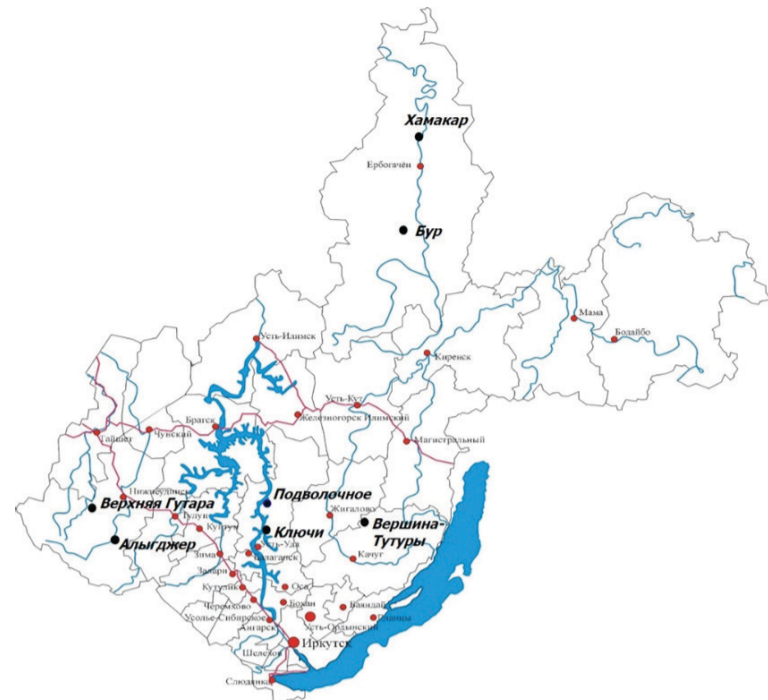
Рисунок 4.1 – Расположения населенных пунктов, выбранных для модернизации системы электроснабжения с использованием ВИЭ

Применение возобновляемых энергоисточников в значительной степени зависит от потенциала возобновляемых природных энергоресурсов. Исходя из анализа величины и внутригодового распределения различных видов ресурсов можно рассматривать целесообразность применения соответствующих типов ВИЭ. В таблице 4.7.1. представлена характеристика этих населенных пунктов.