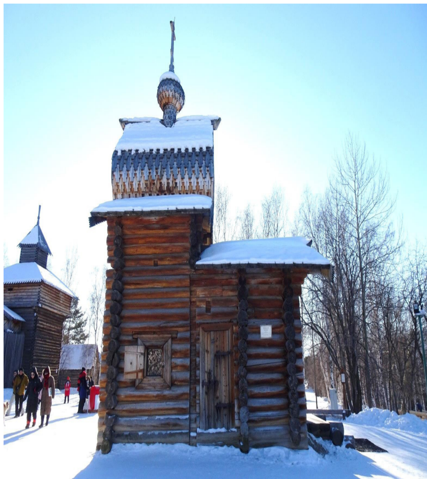
Северный фасад церкви.