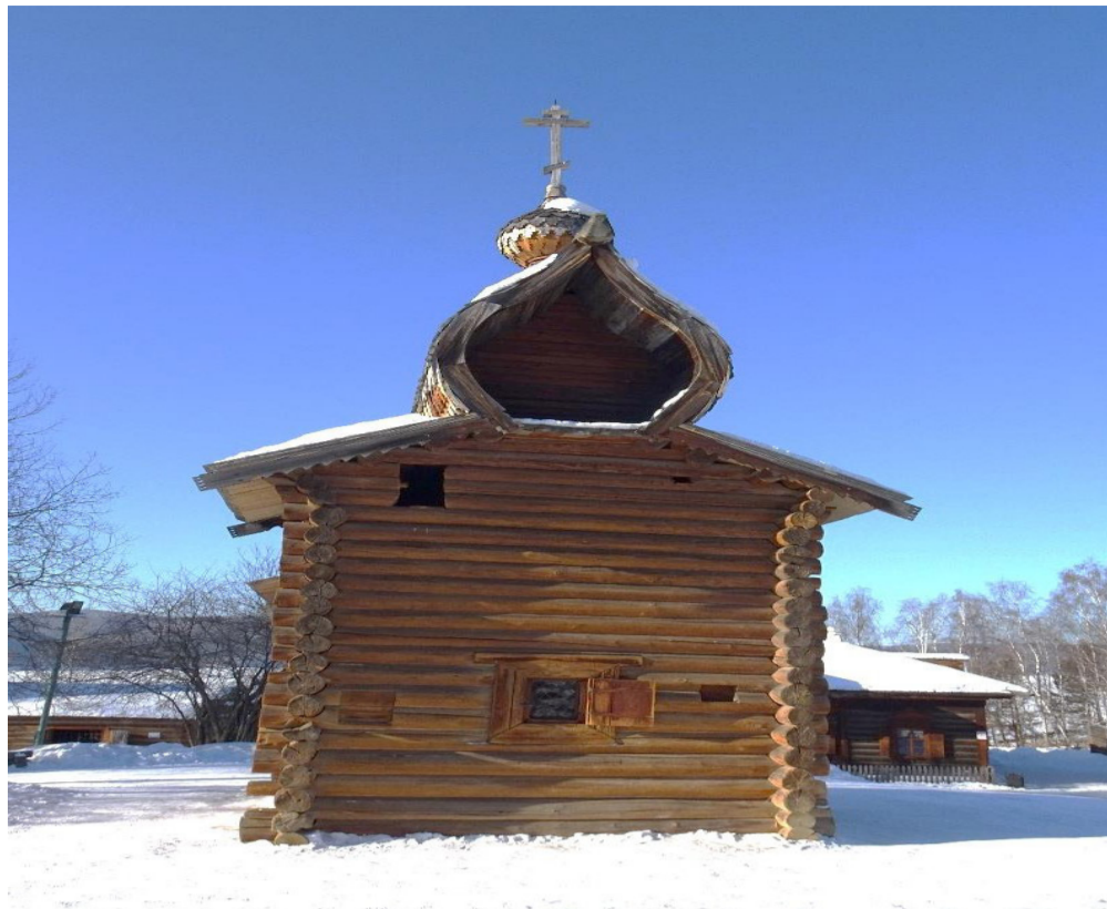
Восточный фасад церкви.