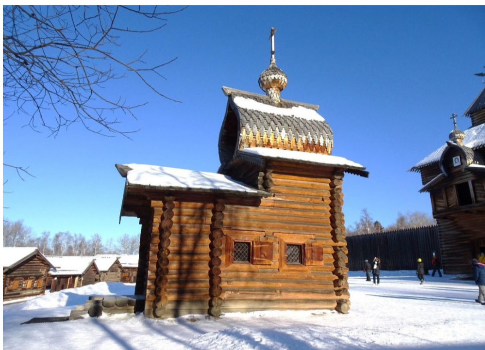
Восточный фасад церкви.

Фотофиксация выполнена: ведущим специалистом-экспертом отдела государственной охраны памятников архитектуры и оформления охранных обязательств службы по охране объектов культурного наследия Иркутской области Денисовой Е.В. Дата выполнения: 27 марта 2020 года.