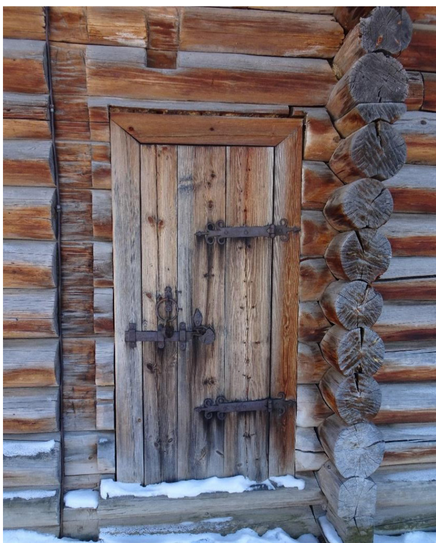
Фрагмент северного фасада.