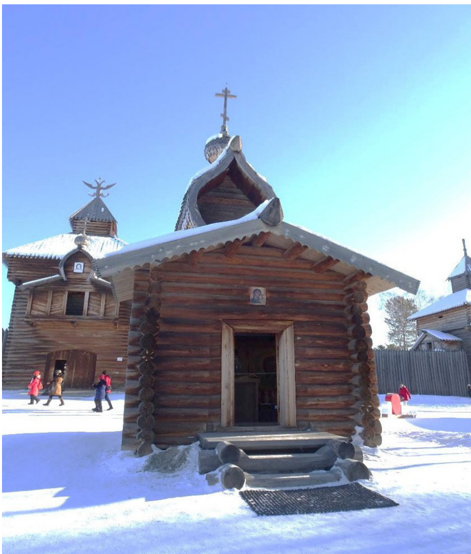
Западный фасад церкви.

Приложение к охранному обязательству Материалы фотофиксации объекта культурного наследия федерального значения «Церковь Казанская (деревянная)», 1679 год расположенного по адресу: Иркутская область, Иркутский район, 47 км шоссе Иркутск-Листвянка, АЭМ «Тальцы». на 4 листах