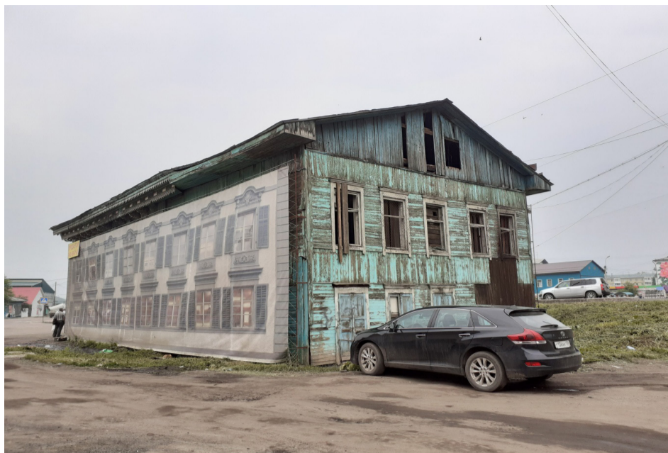
Общий вид здания.