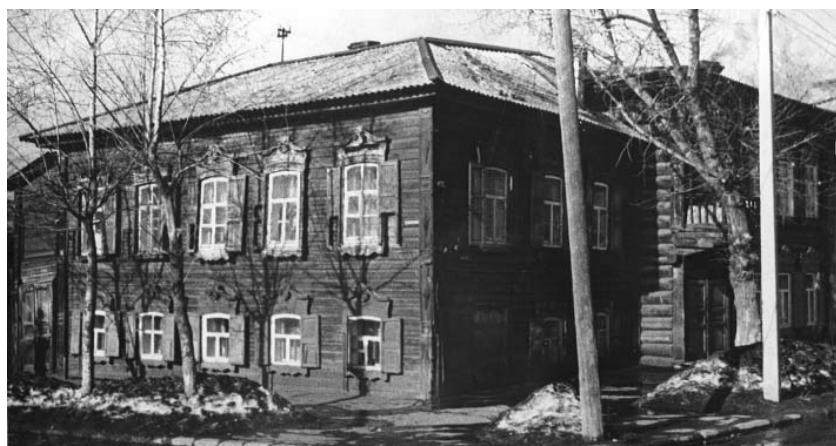
Фото Е.Ю. Барановский, 1976 г. Лит. А. Общий вид с угла ул. Борцов Революции и Софьи Перовской.