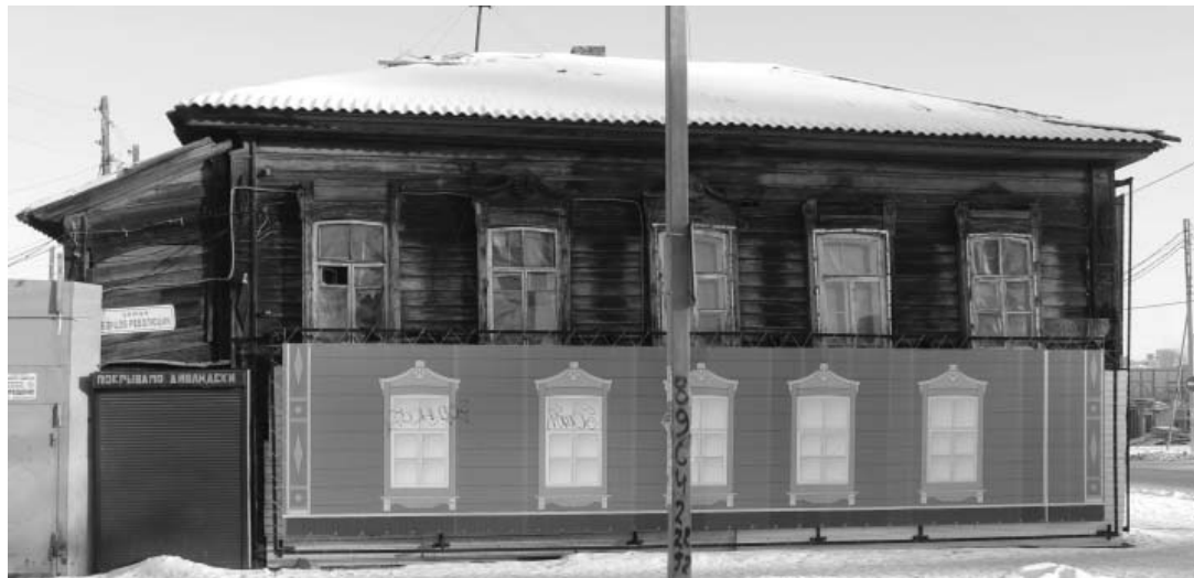
Фото А.А. Жильцов, декабрь 2016 г. Лит. А. Главный (юго-западный) фасад, вид с ул. Борцов Революции.

Фотографическое изображение объекта культурного наследия регионального значения «Усадьба Зеленина: доходный дом, флигель», расположенного по адресу: г. Иркутск, ул. Борцов Революции, 11, лит. А, А1, А2; лит. Б, Б1 (на момент утверждения охранным обязательством) на 2 листах.