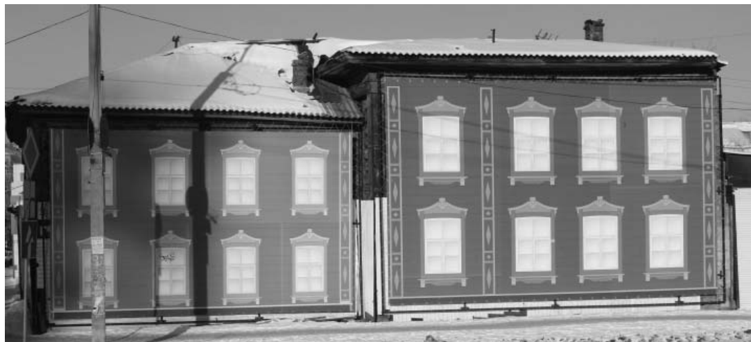
Фото А.А. Жильцов, декабрь 2016 г. Лит. А. Главный (юго-восточный) фасад, вид с ул. Софьи Перовской.