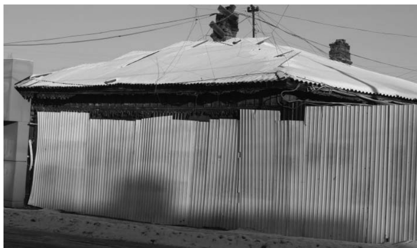
Фото А.А. Жильцов, декабрь 2016 г. Лит. Б. Главный (юго-западный) фасад, вид с ул. Борцов Революции.