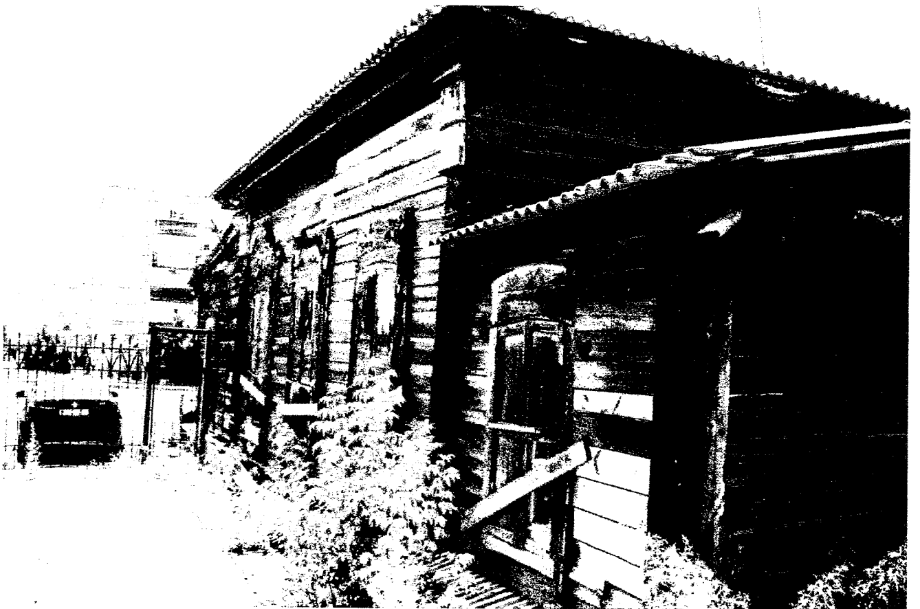
Фото 4 – Юго-восточный фасад