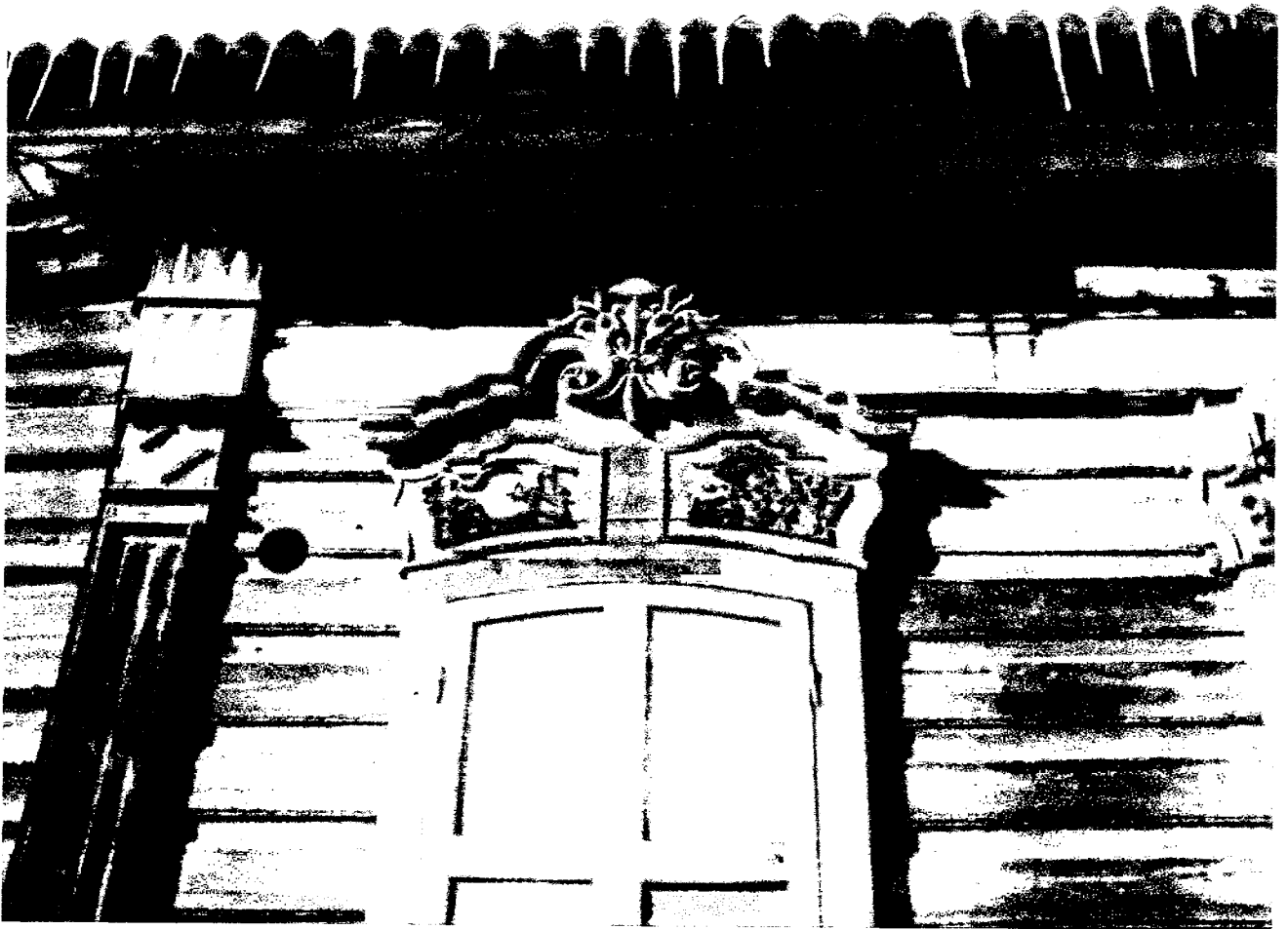
Фото 5 – Фрагмент юго-восточного фасада