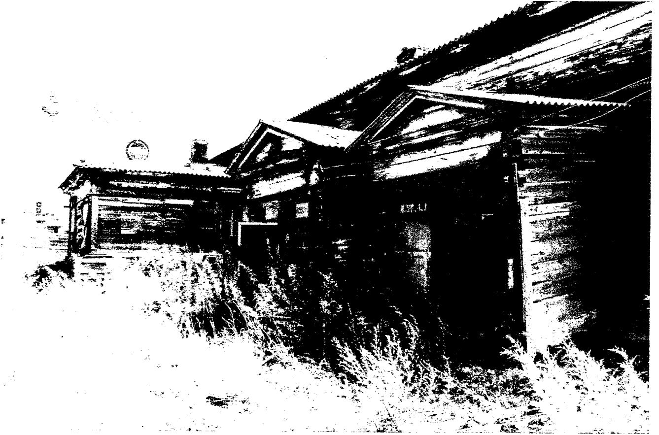
Фото 3 – Северо-восточный фасад