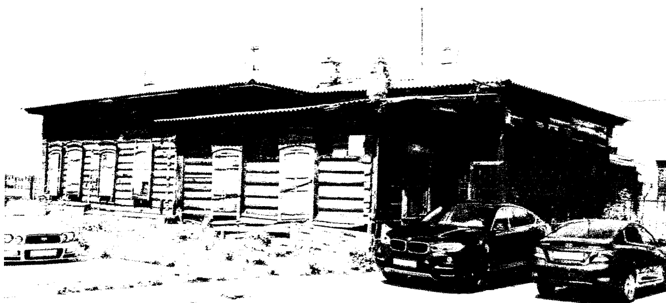
Фото 1 – Общий вид с улицы Франк-Каменецкого. Продольный юго-западный фасад

Приложение к предмету охраны объекта культурного наследия регионального значения «Жилой дом», II пол. XIX в., расположенного по адресу: Иркутская область, г. Иркутск, ул. Каменецкого, 11