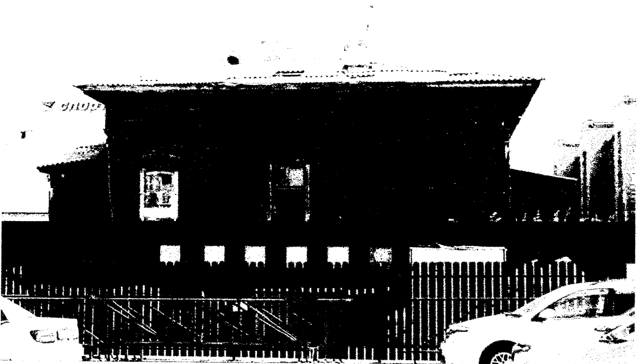
Фото 5 – Северо-западный фасад