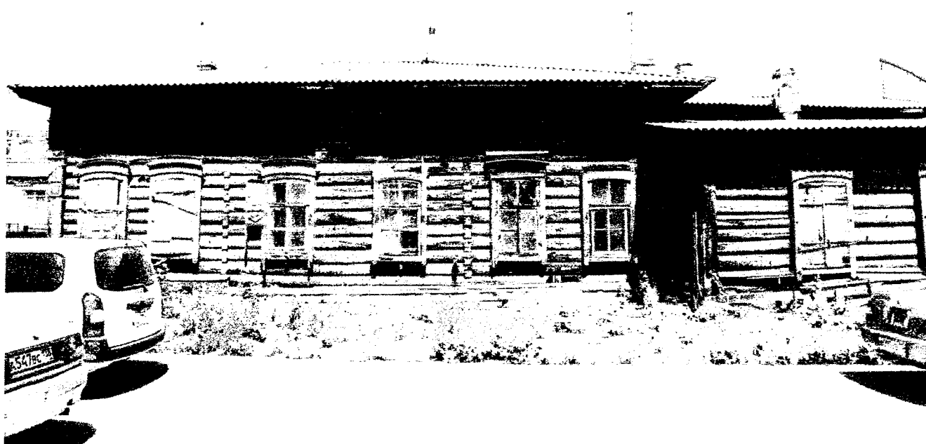
Фото 2 – Продольный юго-западный фасад