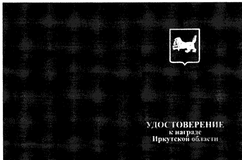
РИСУНОК УДОСТОВЕРЕНИЯ К ЗНАКУ ОТЛИЧИЯ «ЗА ЗАСЛУГИ ПЕРЕД ИРКУТСКОЙ ОБЛАСТЬЮ»

Приложение к описанию удостоверения к знаку отличия «За заслуги перед Иркутской областью»