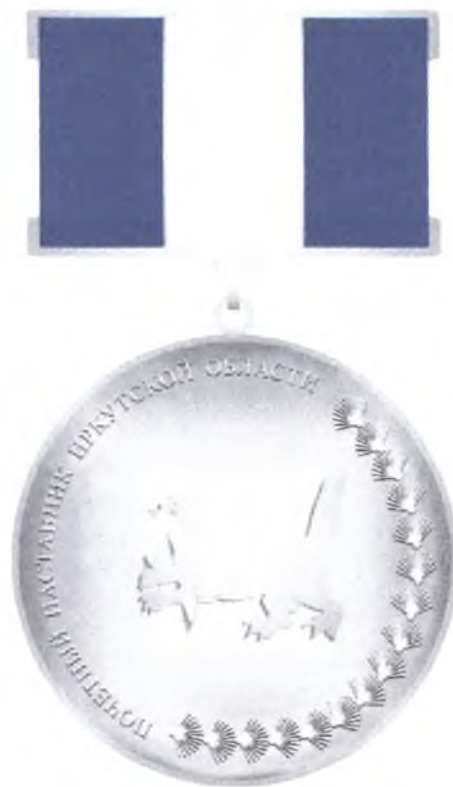
РИСУНОК ЗНАКА ОТЛИЧИЯ «ПОЧЕТНЫЙ НАСТАВНИК ИРКУТСКОЙ ОБЛАСТИ»

Приложение к описанию знака отличия «Почетный наставник Иркутской области»