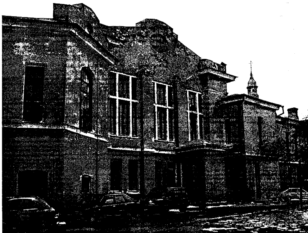
Фото 3 - Северный фасад