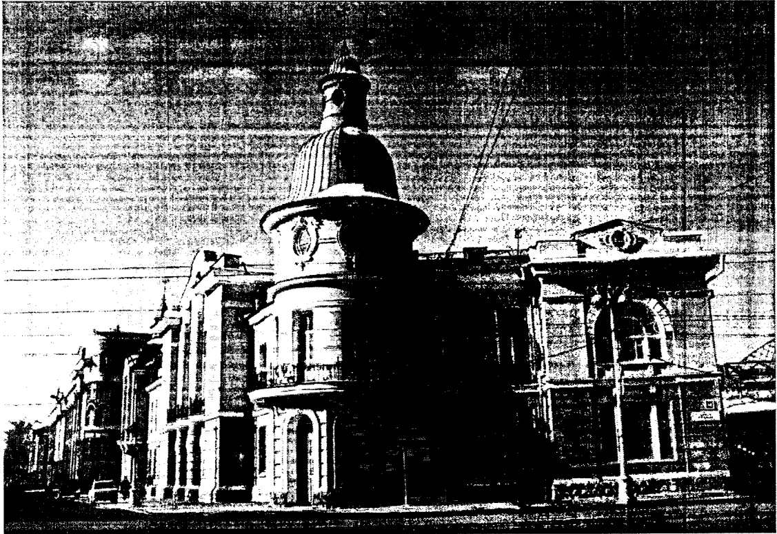
Фото 1 - Восточный фасад

Фотофиксация объекта культурного наследия