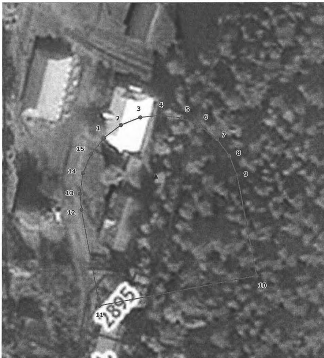
План границ объекта

Используемые условные знаки и обозначения: