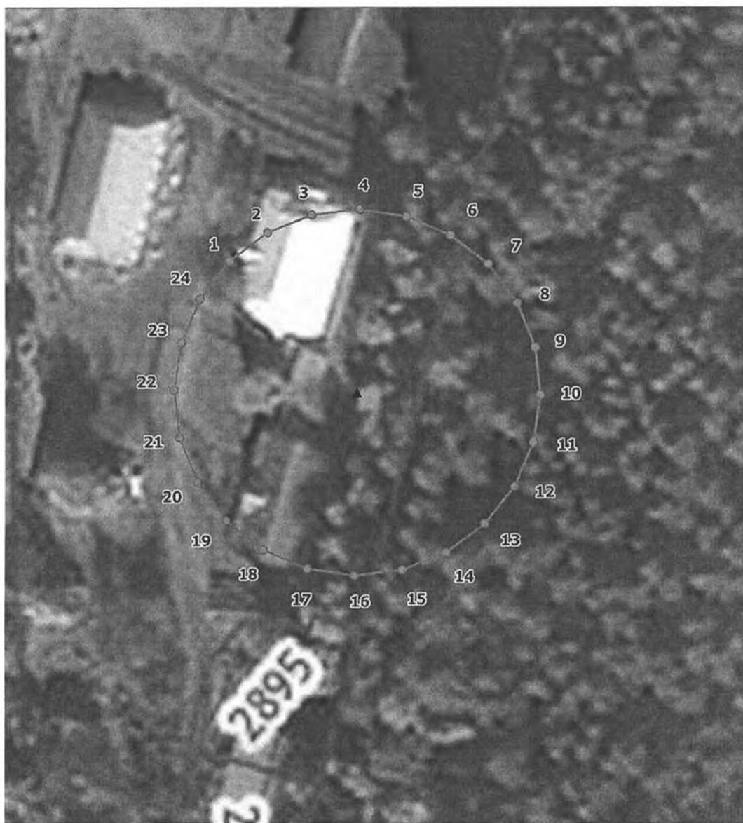
План границ объекта

Используемые условные знаки и обозначения: