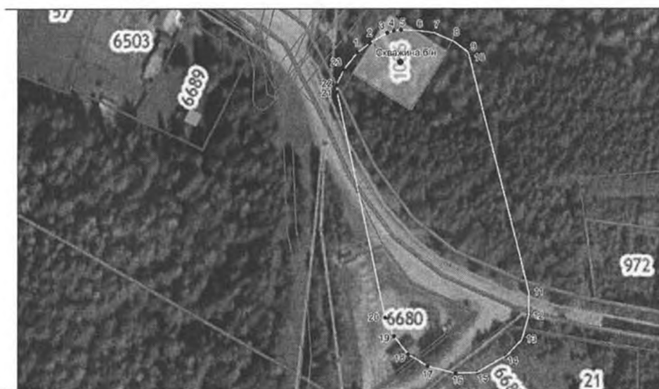
план границ объекта

Второй пояс зоны санитарной охраны одиночного водозабора подземных вод, расположенного в с. Моты, пер. Солнечный, Шелеховского района Иркутской области, устанавливающей границы зоны санитарной охраны подземного источника и ограничения использования земельных участков в ее границах