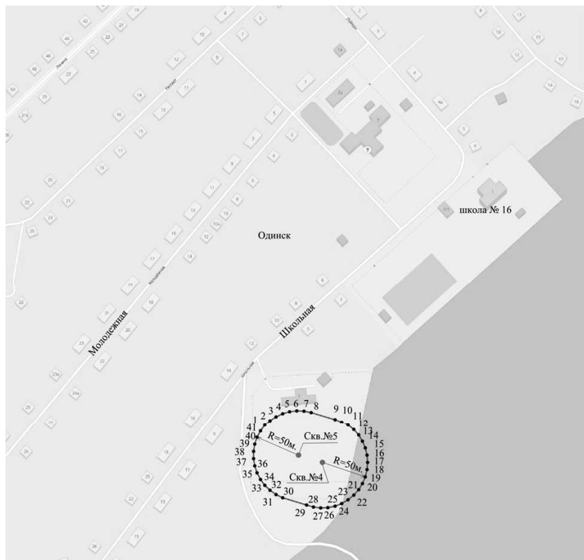
Масштаб 1 : 25 000

Первый пояс зоны санитарной охраны подземного источника водоснабжения действующего водозабора в пос. Одинск Ангарского района Иркутской области