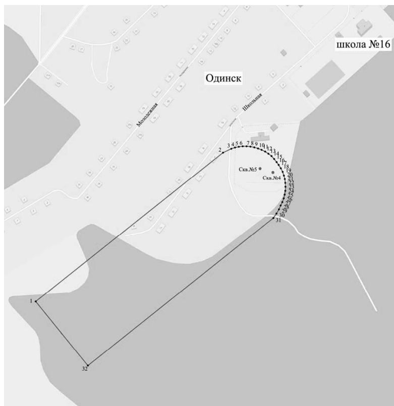
Масштаб 1 : 25 000

Третий пояс зоны санитарной охраны подземного источника водоснабжения действующего водозабора в пос. Одинск Ангарского района Иркутской области