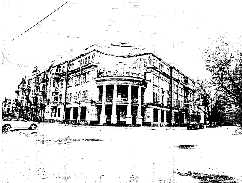
Общий вид на здание с ул. Цесовская Набережная.