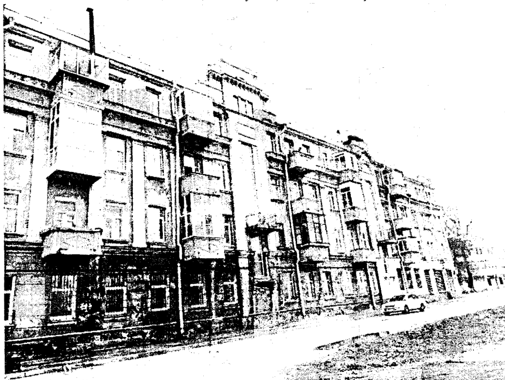
Общий вид с востока на ул. Цесовская Набережная. Слева расположен исследуемый дом, справа – река Ангара.