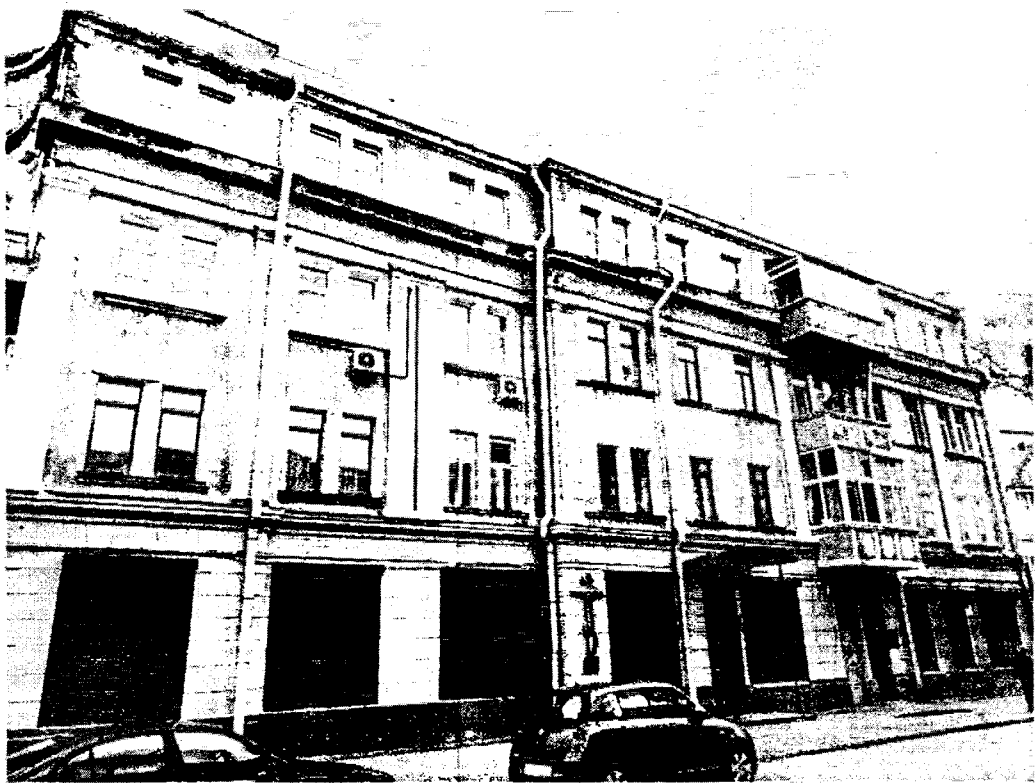
Общий вид на главный (южный) фасад крыла выходящего на ул. Чудотворскую.