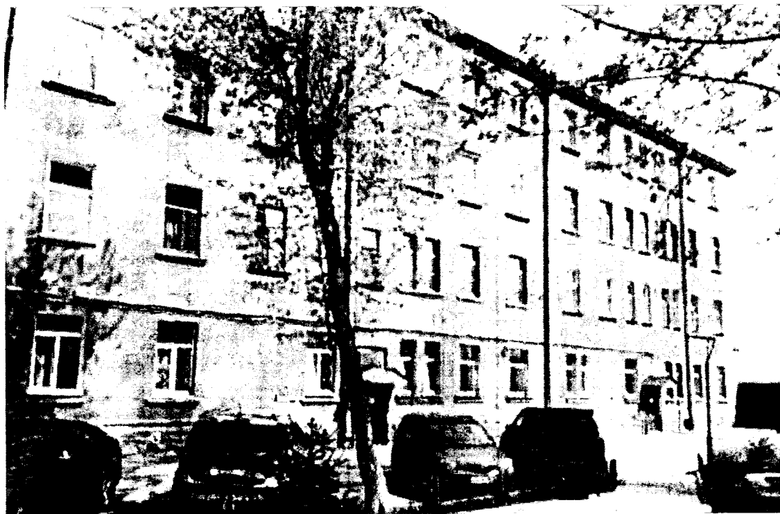
Дворовой южный фасада