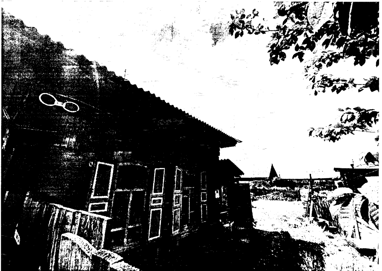
4. Общий вид дворовой территории Объекта со стороны улицы Коммунистической