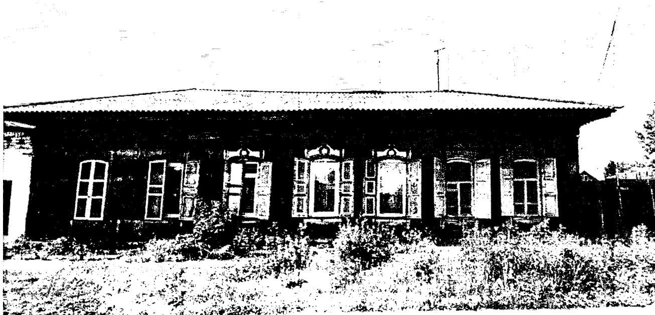
2. Общий вид главного фасада Объекта со стороны улицы Коммунистической