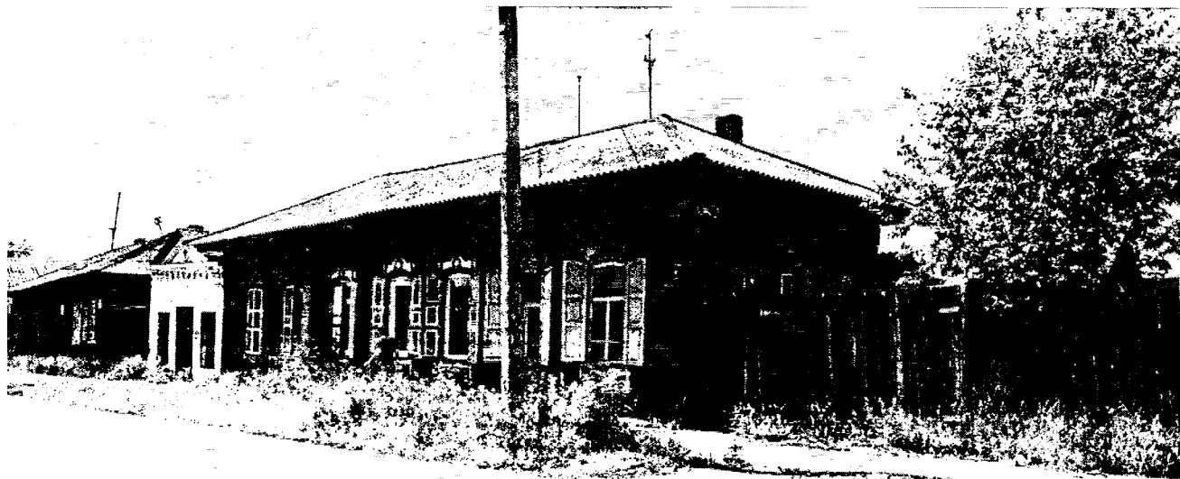
1. Общий вид Объекта со стороны улицы Коммунистической