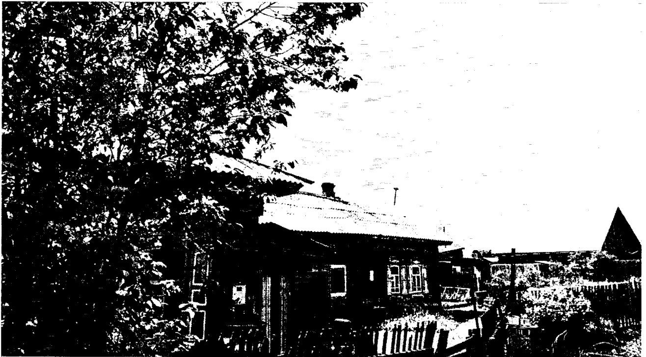
3. Общий вид дворовой территории Объекта со стороны улицы Коммунистической