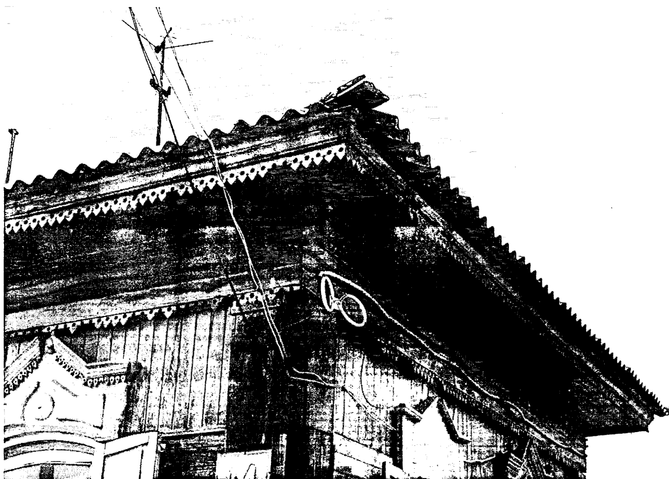
5. Отдельные декоративные элементы фасада Объекта