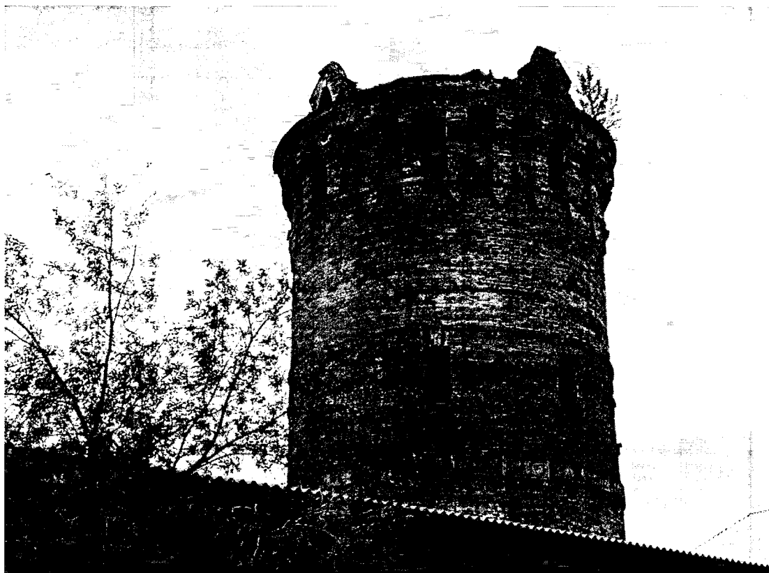
3. Общий вид водоподъемной башни с западной стороны