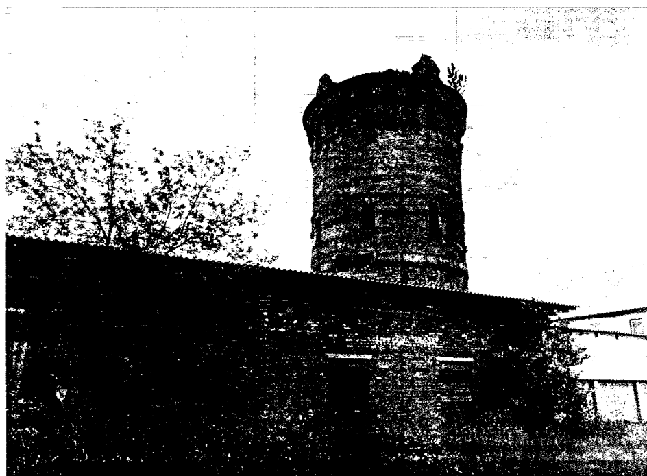
2. Общий вид водоподъемной башни с северо-западной стороны