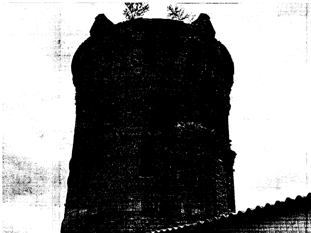
4. Общий вид водоподъемной башни с восточной стороны