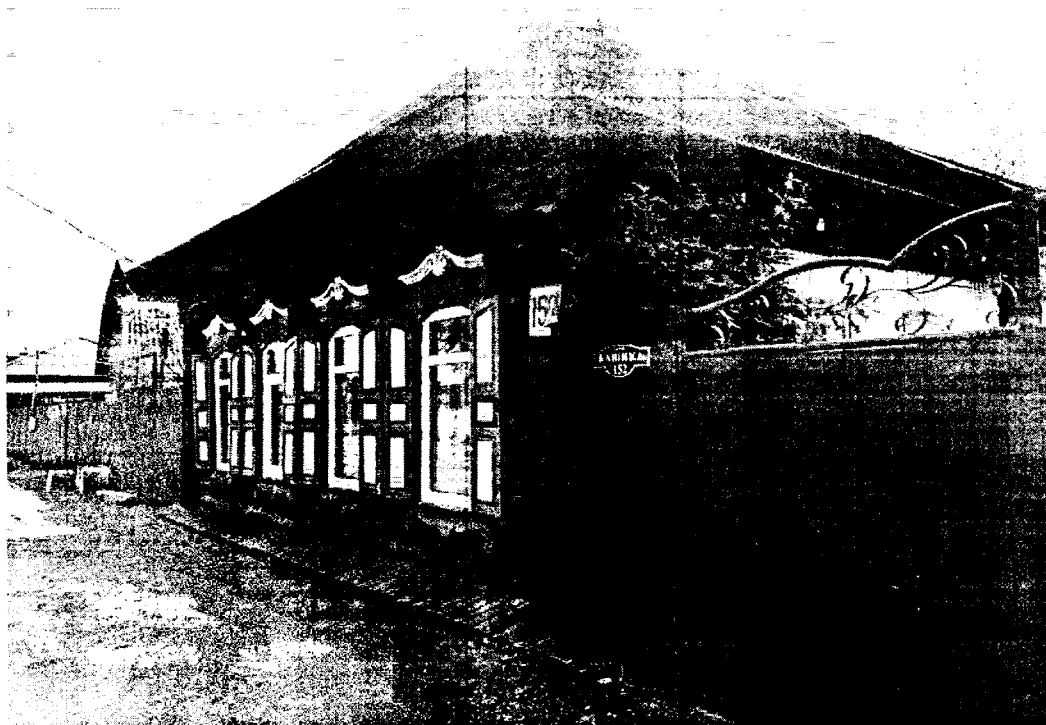
1. Общий вид Объекта со стороны ул. Кашика