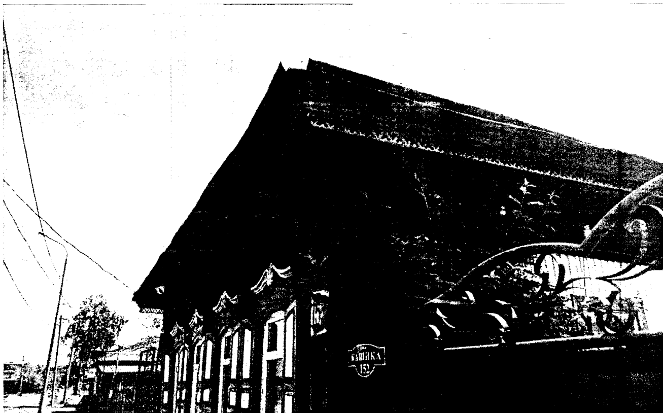
4. Общий вид отдельных декоративных элементов фасадов Объекта