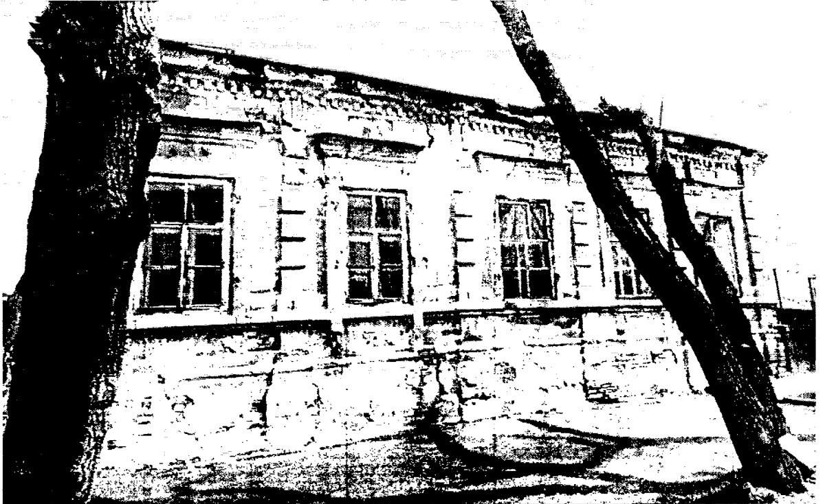
Фото 1 – Главный (западный) фасад