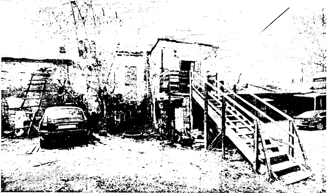
Фото 3 – Дворовой фасад