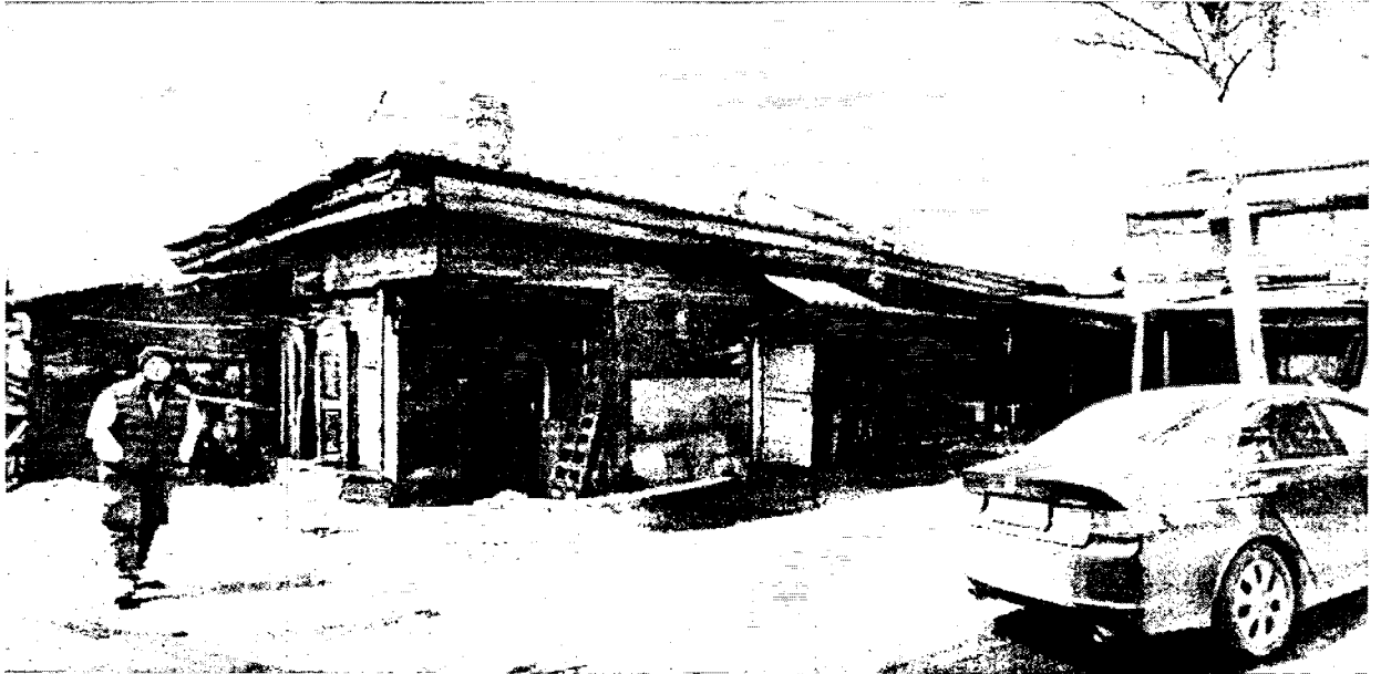
Фото 3 – Дворовой (восточный) фасад первоначального объема