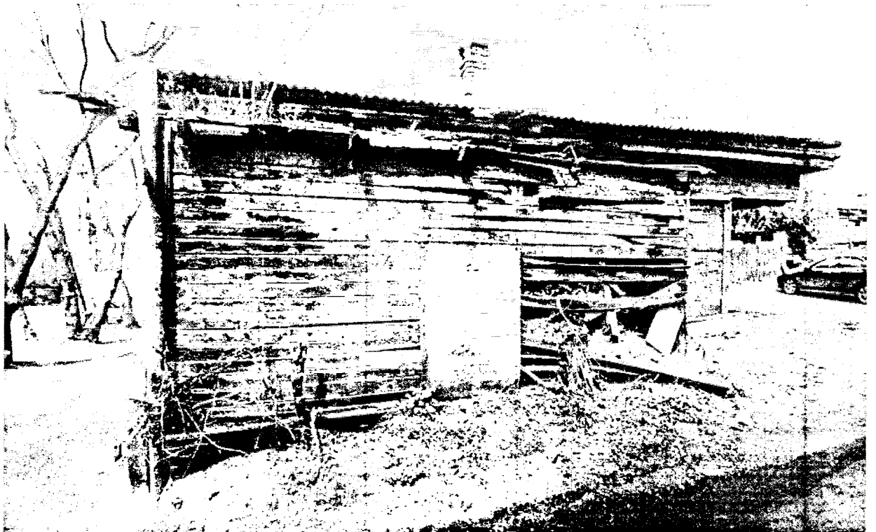
Фото 4 – Боковой (южный) фасад