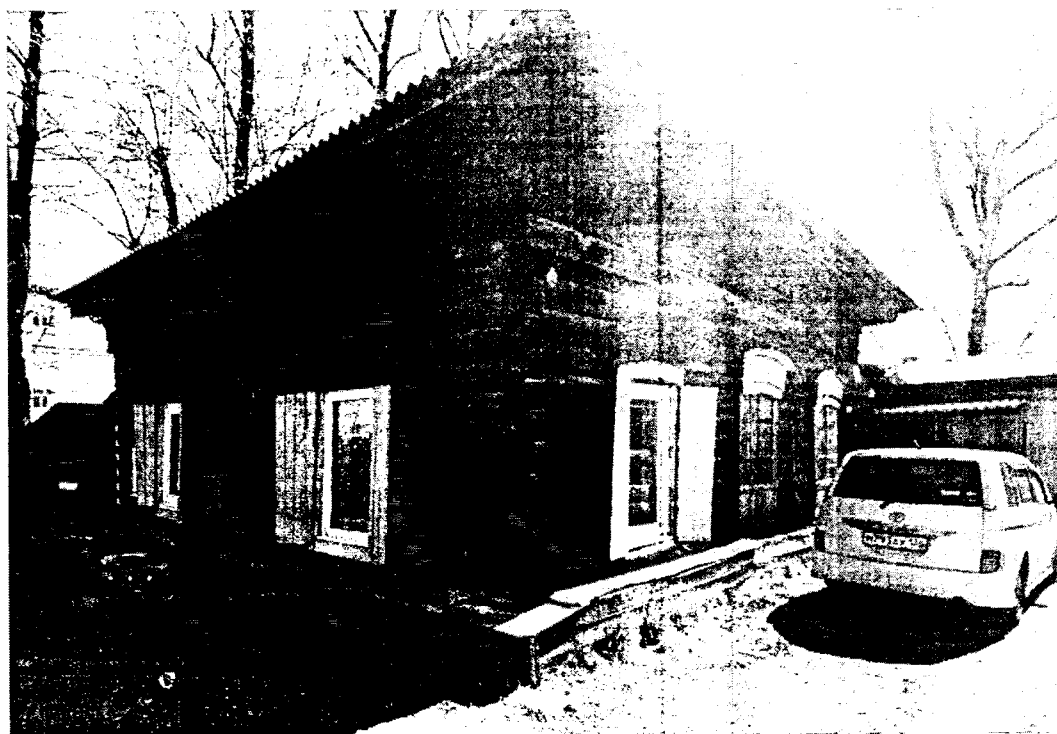
Фото 2 – Вид на здание с восточного угла