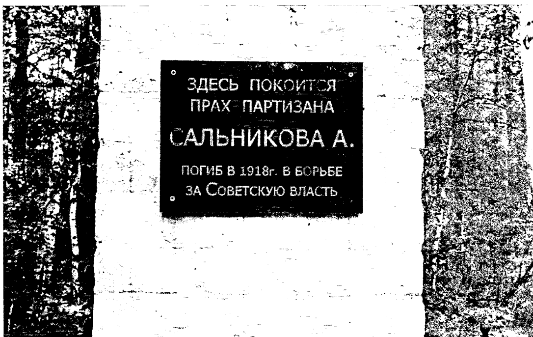
Фото 2 – Общий вид на Объект с юга