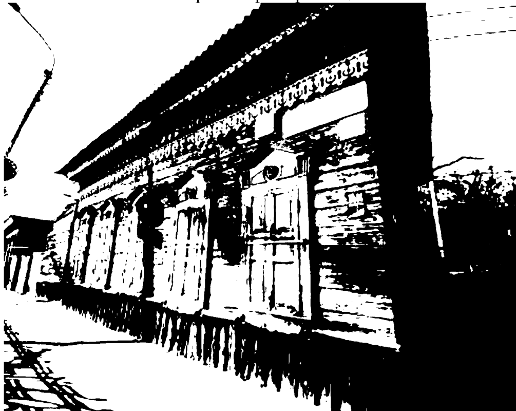
Фото 1 – Главный (юго-западный) фасад исследуемого здания