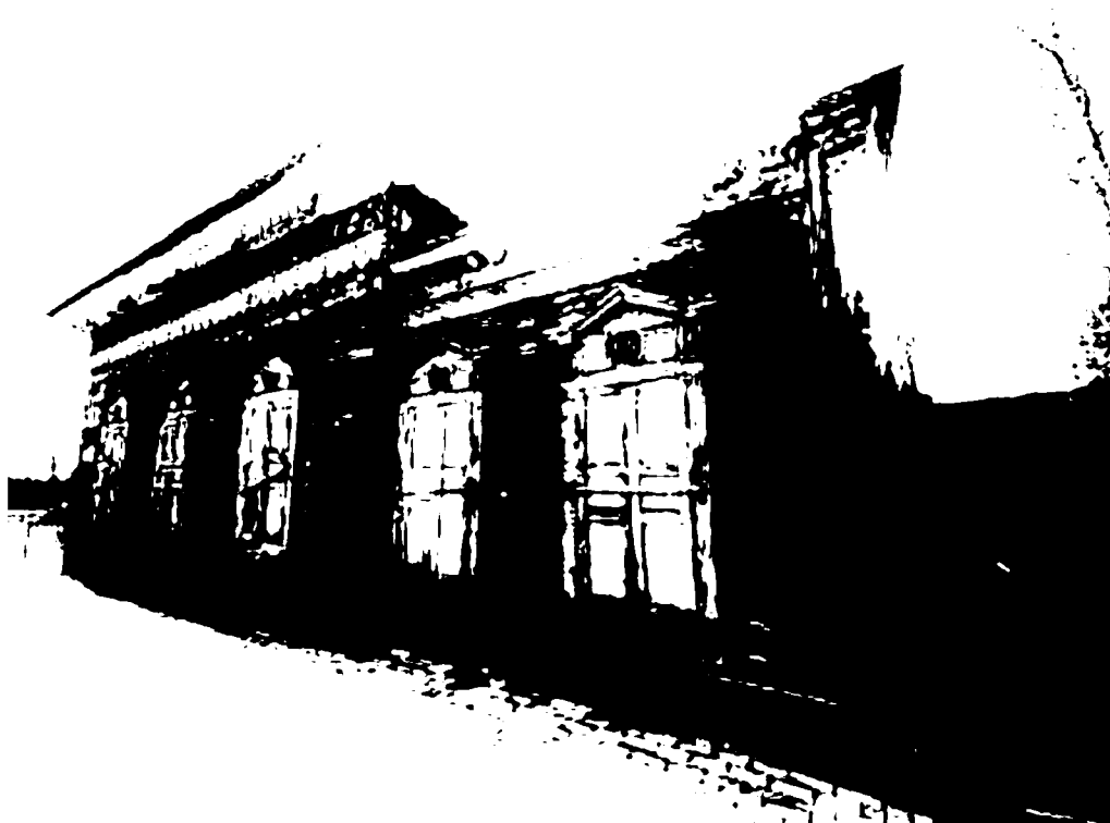
Фото 2 – Лицевой (юго-восточный) фасад здания по ул. Красного Восстания