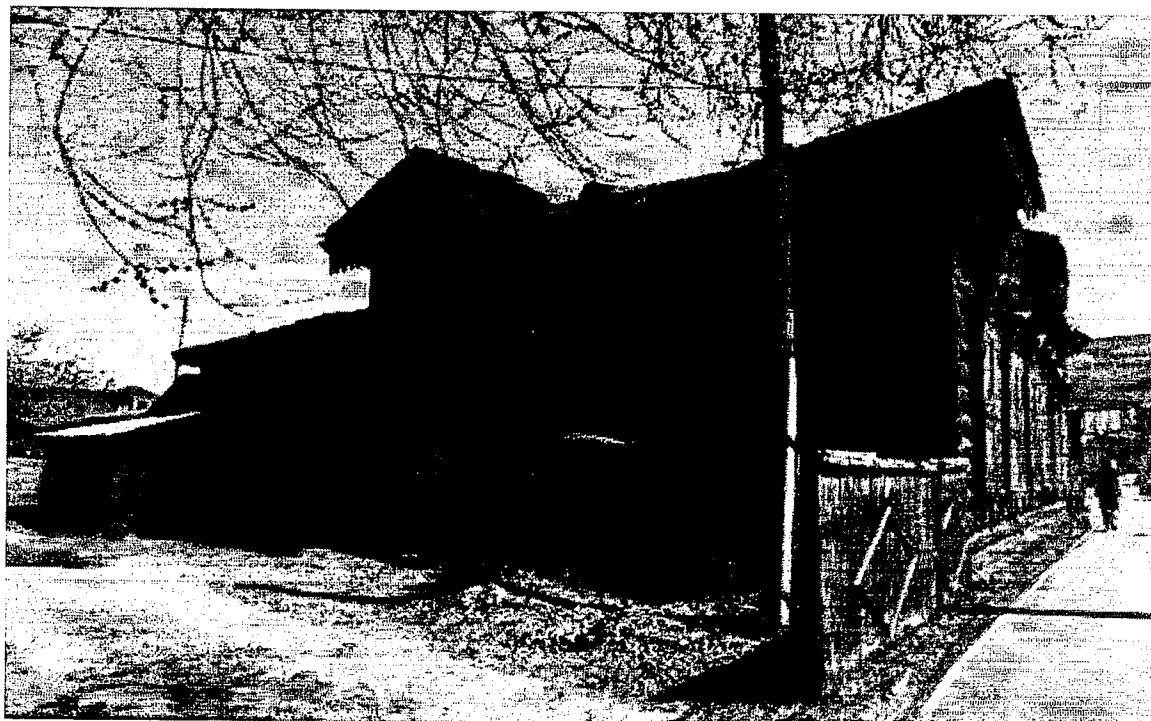
Фото 4 – Боковой северо-западный фасад