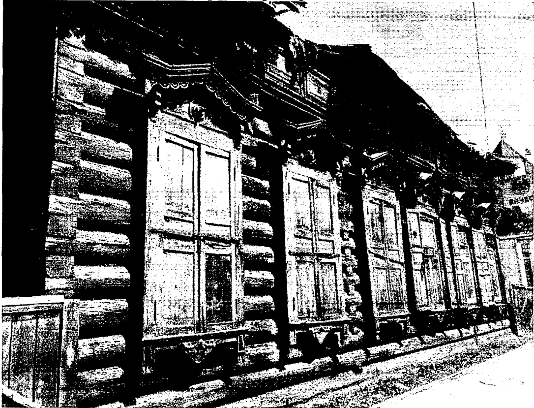
Фото 1 – Главный фасад дома по ул. Баррикад