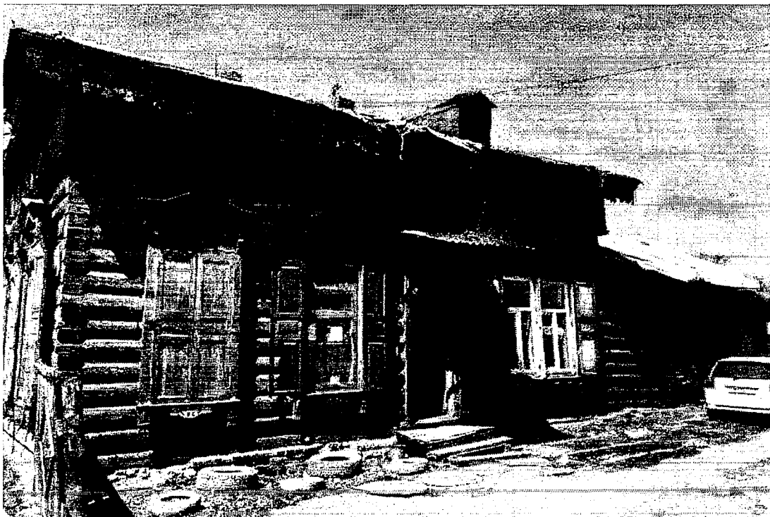
Фото 2 – Боковой юго-восточный фасад.