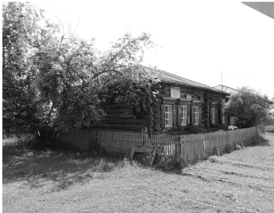
Фото 1 – Главный фасад и торцевой (левый) фасад