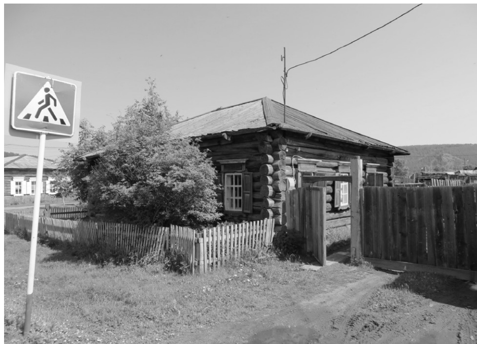
Фото 2 – Торцевой (правый) фасад