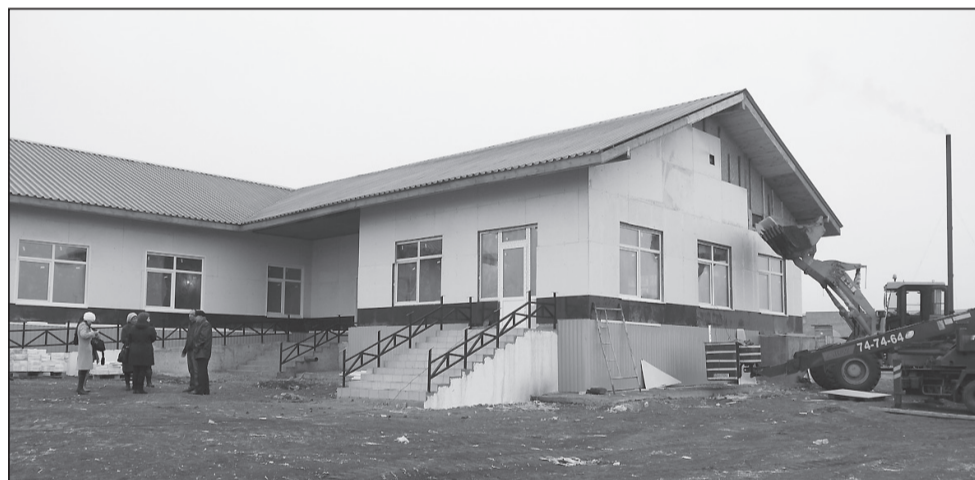
Будущий детский сад в Алужино

Подрядчик детского сада в Алужино – ООО «Ардос» на текущий момент выполнил 40% работ. Здание возведено из современного материала – деревянных стенопанелей. Осталось произвести внутреннюю чистовую отделку, наружную