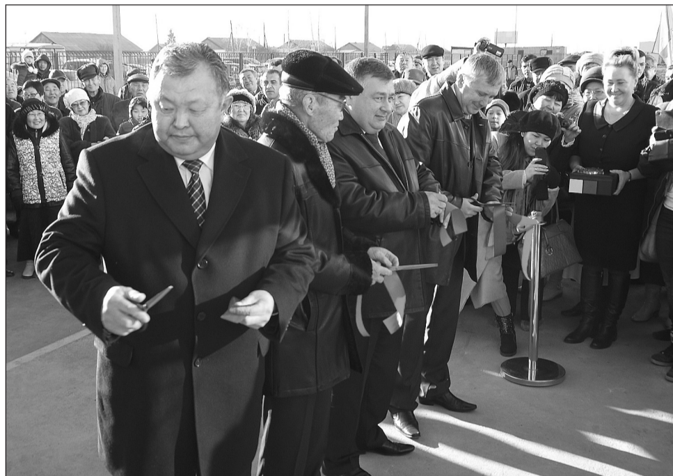
Торжественный момент открытия спорткомплекса традиционно сопровождался перерезанием красной ленты