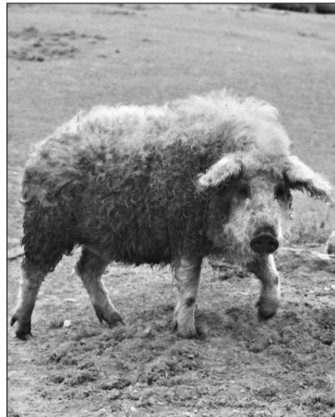
Спины взрослых животных «венгерской мангалицы» покрывает завивающийся кольцами густой пух. У малышей, как у диких кабанчиков, по бокам красуются полоски