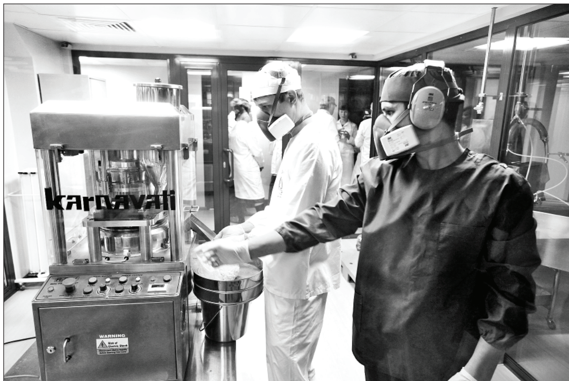
В Иркутской области работает один из самых технологически оснащенных проектов – фармацевтическая компания «Фармасинтез», которая выпускает противотуберкулезный препарат «Перхлосон». Перед правительством РФ был поставлен вопрос о включении его в список лекарств, отпускаемых по квотам противотуберкулезным больницам

Большим плюсом нужно считать выдачу амбулаторным больным так называемого продуктового набора – на всем протяжении «домашнего лечения» пациенты ежемесячно получают бесплатный паек.