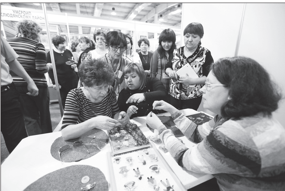
На выставке-ярмарке «И невозможное возможно» состоялись деловые встречи, переговоры, круглые столы, увлекательные выступления творческих коллективов, а также мастер-классы

действительно уникальные ребята. Очень талантливые и трудолюбивые.