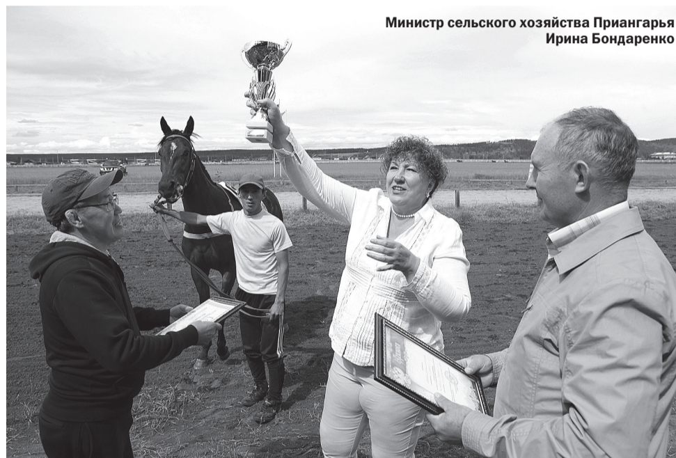
Министр сельского хозяйства Приангарья Ирина Бондаренко