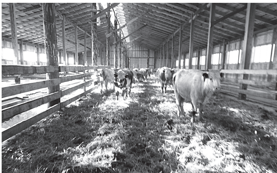
Половина строения будет с обогревом – в ней разместятся молочный и родильный блоки, а также помещения для телят; во втором отсеке коровы будут содержаться на так называемой глубокой подстилке

Виктор ПРОСЕКИН