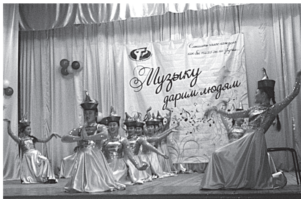
Звезда не только школы искусств, но и всего Баяндаевского района – народный хореографический ансамбль «Грация»

Здесь работают восемь социальных педагогов, инструктор по труду, специалист по социальной работе. Результат их усилий заметен – дети уверенно держатся, общаются без напряжения. Процесс социальной реабилитации направлен на привитие трудовых навыков: мальчиков