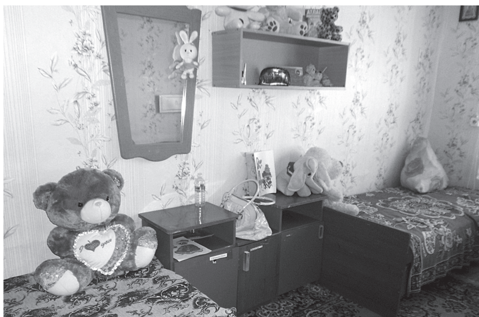
В комнатах социально-реабилитационного центра живут по три-четыре человека. Обстановка почти домашняя

этого года вернули в семьи 41 ребенка, под опеку взяли 12 и пять детей направили в детские дома.