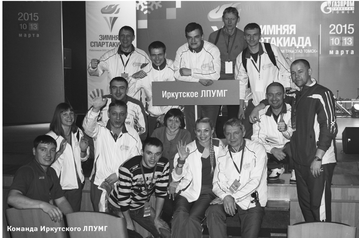
Команда Иркутского ЛПУМГ

Также впервые в физкультурных талантах показали себя руководители: на старт лыжной эстафеты от каждого филиала вышли директор, начальник учетно-контрольной группы и руководитель профсоюзной организации. Эти состязания вызвали у болельщиков особый интерес. Подчиненные активно болели за своих любимых шефов, подбадривали, как могли, искренне радовались победам и огорчались поражениям.