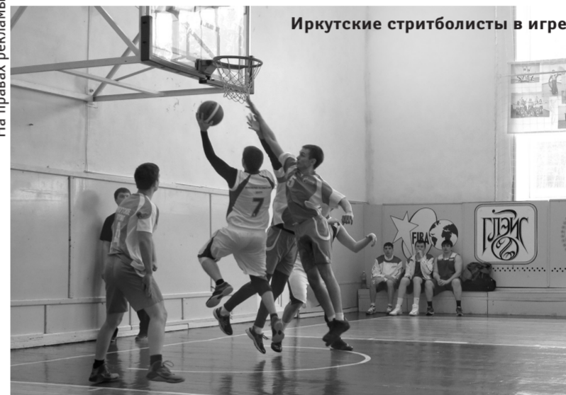
Иркутские стритболисты в игре

одной игры спешили на другую. Да и участники между соревнованиями демонстрировали нешуточную скорость: прямо из бассейна, переодевшись, бежали на лыжную гонку.