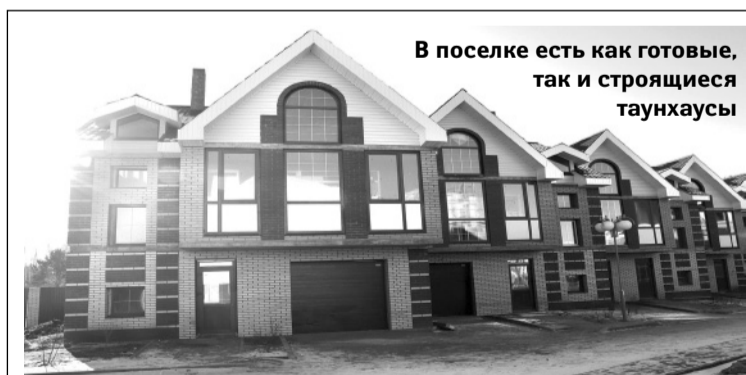
В поселке есть как готовые, так и строящиеся таунхаусы