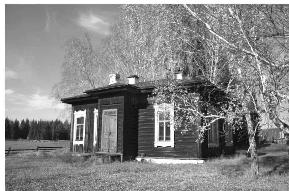
В деревне Тагна установят памятник солдатам Великой Отечественной войны

Людмила ШАГУНОВА