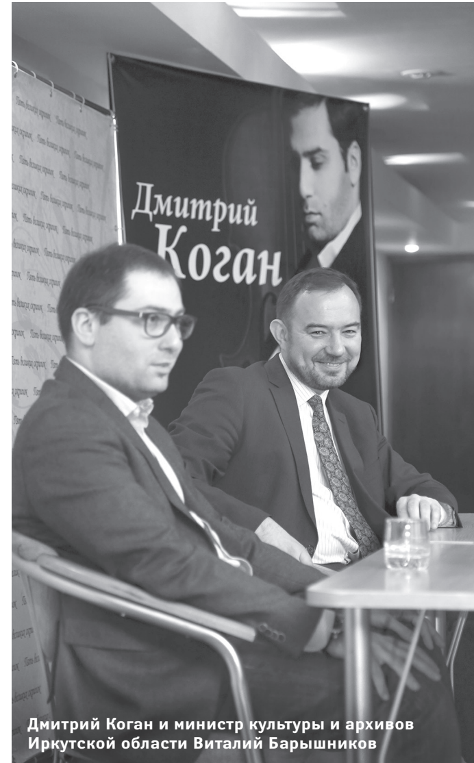
Дмитрий Коган и министр культуры и архивов Иркутской области Виталий Барышников