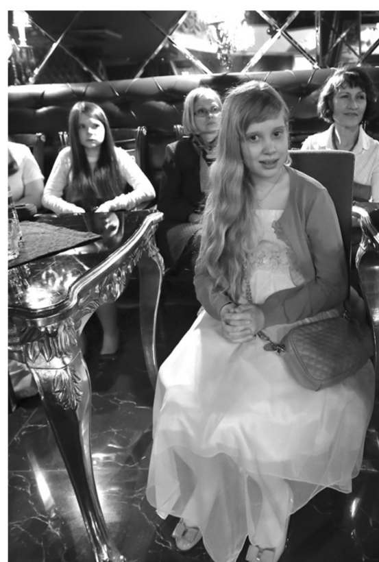
Среди детей с ограниченными возможностями такие акции очень востребованы, поэтому их намерены проводить и дальше