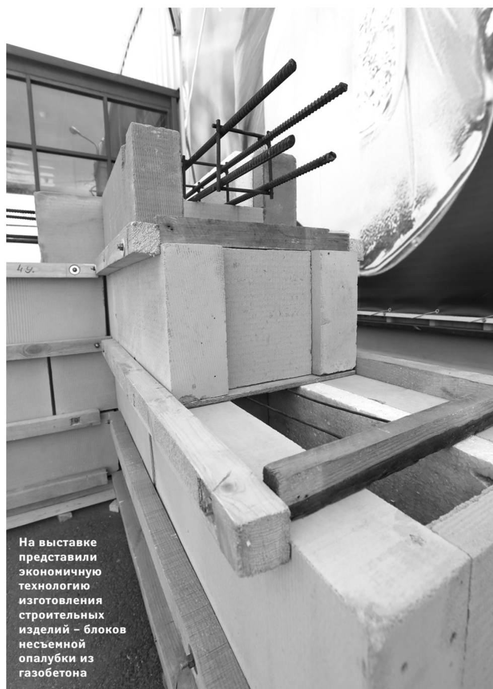
На выставке представили экономичную технологию изготовления строительных изделий — блоков несъемной опалубки из газобетона

В рамках выставки также прошли презентации новинок в сфере строительства, мастер-классы по их применению, круглые столы, семинары и демонстрации оборудования. Так, 21 мая посетители строительной недели могли увидеть в работе станок термической (плазмен-