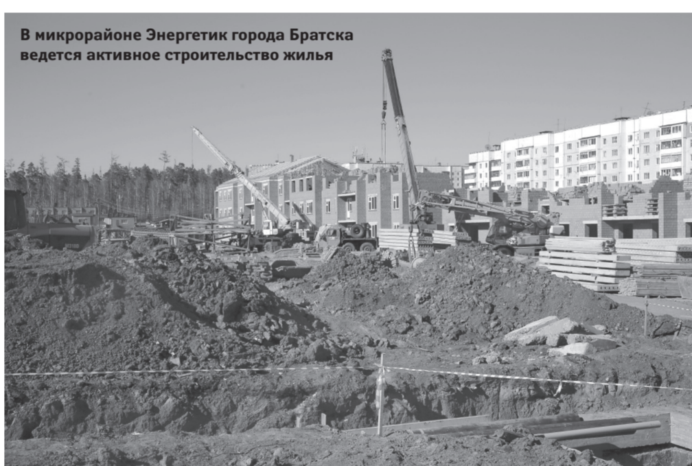
В микрорайоне Энергетик города Братска ведется активное строительство жилья

— Я отдыхал на Алтае, там на четыре-пять рублей литр бензина дешевле, у нас