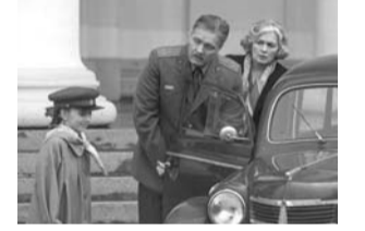
Семейная сага рассказывает о судьбе нескольких поколений женщин семьи Антоновых-Тереховых...

Режиссер Дмитрий Петрунь. В ролях: Константин Милованов, Мария Порошина. Украина, Россия, 2015.