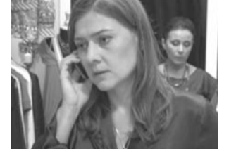
Татьяна - безжалостная и властная женщина. Много лет назад она приехала из провинциального городка в Москву...