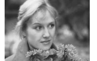
Молодые супруги отправляются на теплоходе в свадебное путешествие. В пути возникает пожар...