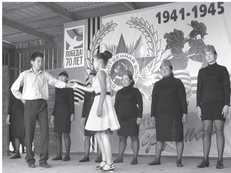
Участники районного конкурса «Фронтальная концертная бригада «Салют, Победа!»

Кроме того, внутри здания были обнаружены мелкие трещины стен и вздувшийся линолеум. Все эти проблемы, как и протечка кровли, уже решены. В настоящее время на территории переделывают веранды, в кон-