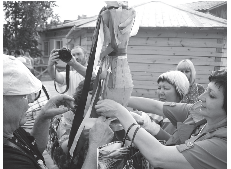
Участники фестиваля побывали в памятных местах Усть-Ордынского Бурятского округа