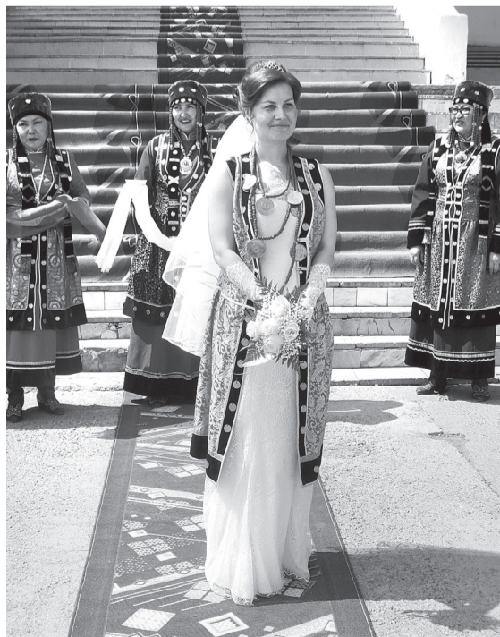
Невеста во время церемонии, организованной в соответствии с бурятскими традициями