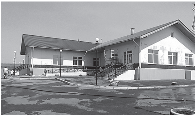
В процессе эксплуатации здания детского сада села Алужино выявились недостатки, которые строителям предписано устранить

В процессе эксплуатации здания выявились недостатки. Один из видимых невооруженным глазом – облупившаяся со-