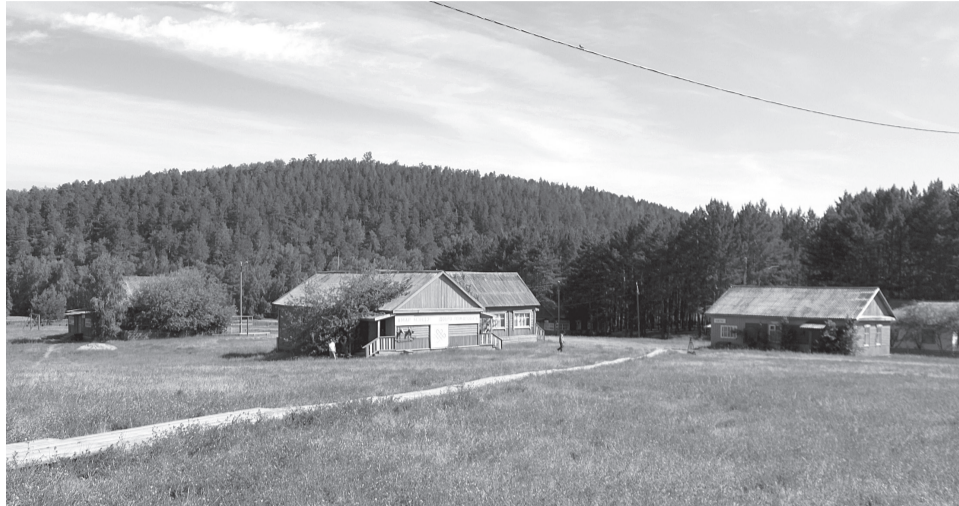
12 сельских поселений Осинского района уже много лет к началу летнего сезона берут шефство над лагерем и ремонтируют домики