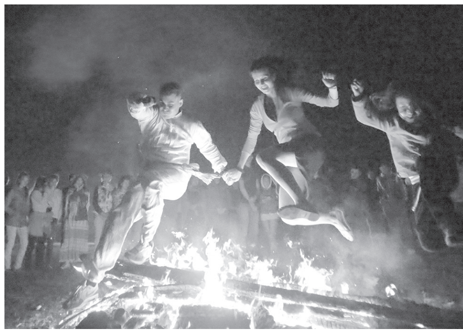
Одно из главных действий праздника — очищение огнем. Костер на Купалье должен гореть всю ночь. Пламя славяне считали священным и верили, что оно избавит от болезней, горестей и печалей.

Несмотря на то, что в Иркутской области некоторые деревни ежегодно отмечают Купалье, следуя традициям предков, массовую популярность праздник приобрел только в последние годы. Во многом этому способствовала активная деятельность участников Иркутского товарищества белорусской культуры им. Я. Д. Черского, а также активистов молодежного клуба «Крывичи».