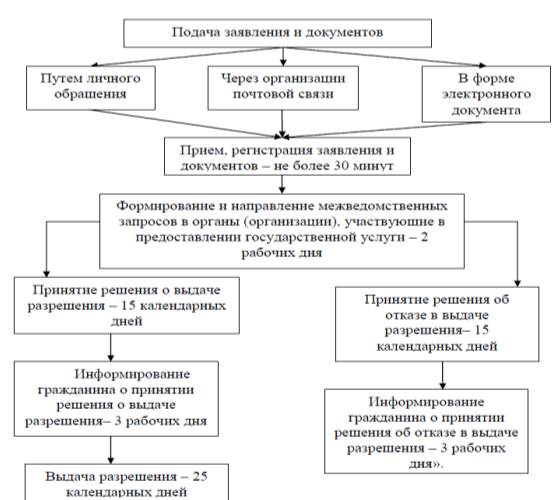
Блок-схема предоставления государственной услуги

Приложение 2 к приказу министерства социального развития, опеки и попечительства Иркутской области от «2» июля 2015 года № 96-мпр