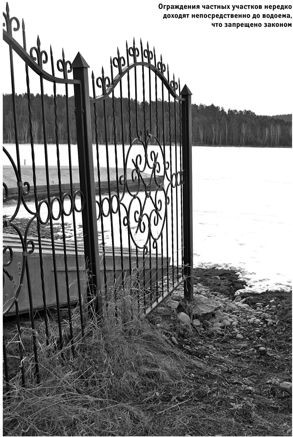
Ограждения частных участков нередко доходят непосредственно до водоема, что запрещено законом