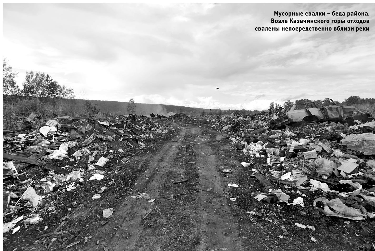
Мусорные свалки – беда района. Возле Казачинского горы отходы свалены непосредственно вблизи реки

Жителям другого труднодоступного муниципалитета Казачинско-Ленского района – Мартыновского сельского поселения, где также работали