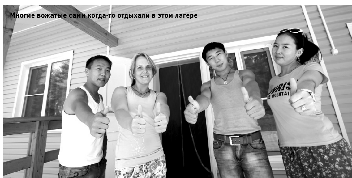
Многие вожатые сами когда-то отдыхали в этом лагере

В детском лагере «Березка» Нукутского района построен новый жилой корпус, который по достоинству оценили юные постояльцы и вожатые. В планах руководства детского учреждения дальнейшее обновление инфраструктуры, чтобы в будущем перевести лагерь на круглогодичную работу и принимать детей со всей Иркутской области.