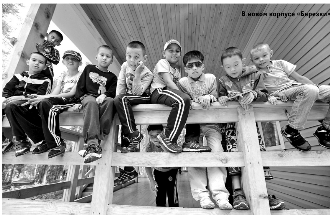
В новом корпусе «Березки»

Строительство пионерского лагеря началось в конце 60-х годов прошлого века. Тогда его возводили всем миром, каждое предприятие Нукутского района взяло на себя обяза-