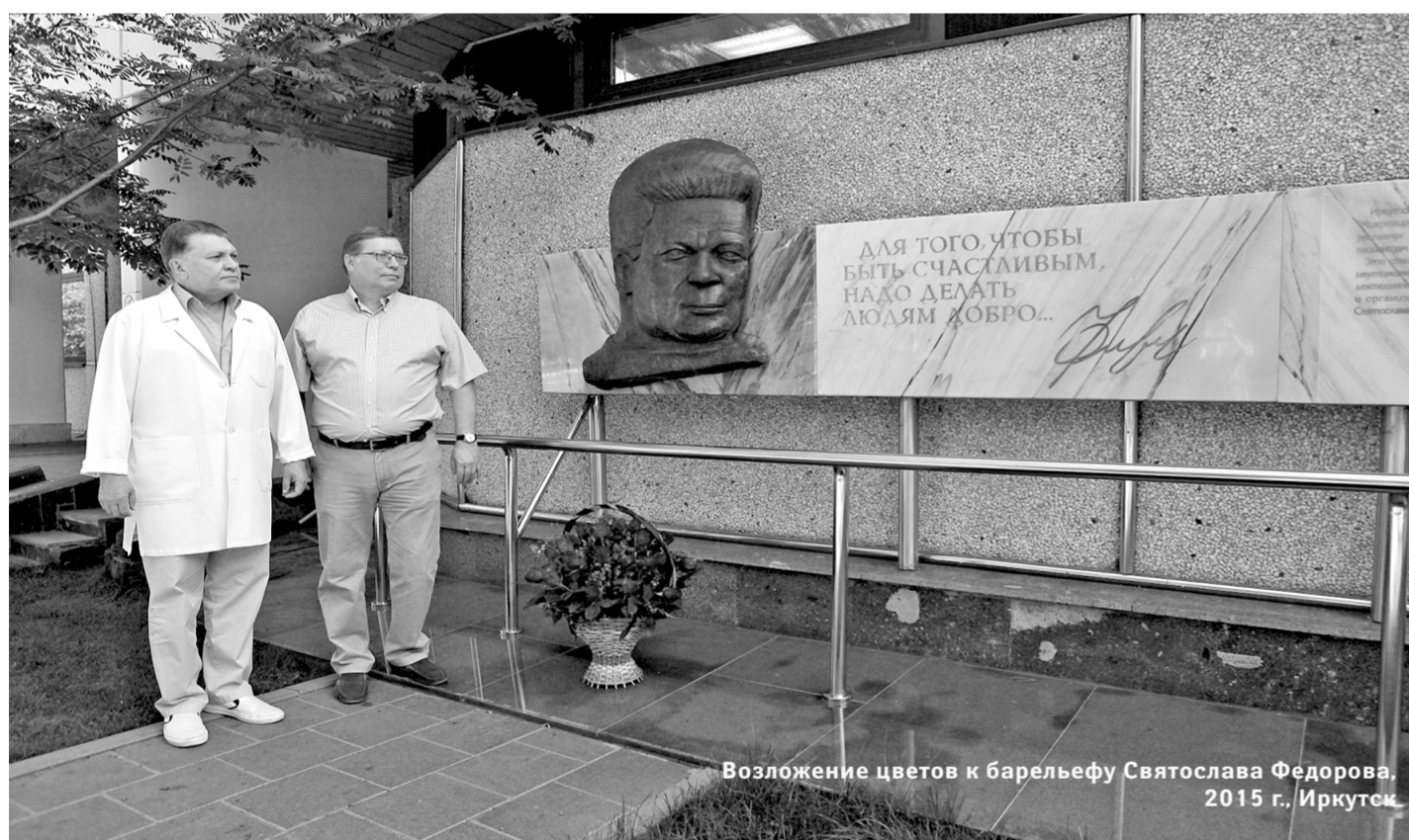
Возложение цветов к барельефу Святослава Федорова, 2015 г., Иркутск

Имеются противопоказания. Требуется консультация специалиста