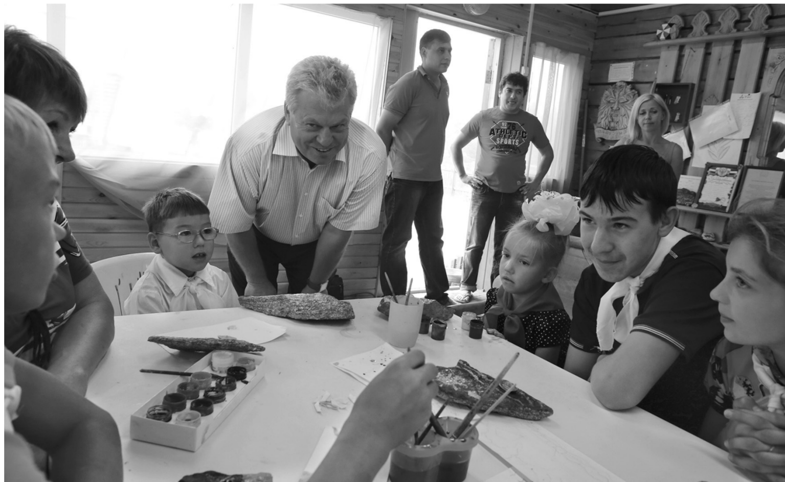
В последние дни работы лагеря «Мандархан» посетил и.о. министра социального развития, опеки и попечительства Иркутской области Владимир Родионов

— Лагерь развивается и расширяется. В этом году был построен новый корпус на 16 человек. В следующем году планируется строительство дополнительного корпуса также на 16 мест, что позволит организовать дополнительную специализированную смену. Три года назад, когда проект только появился, оздоровительные сезоны длились по пять дней, со временем их уда-