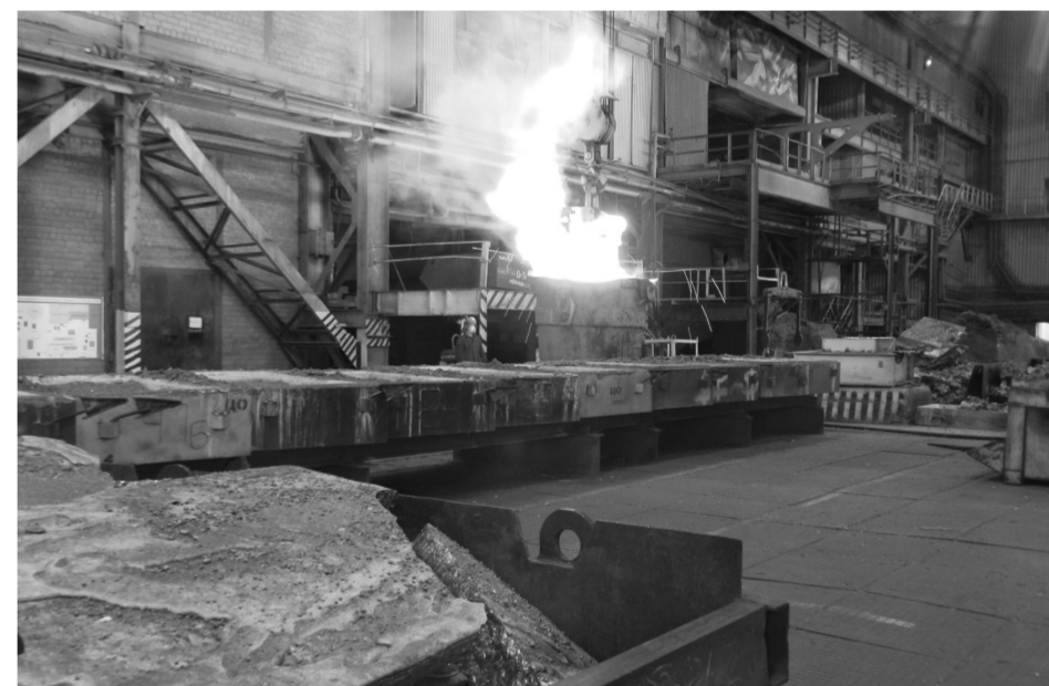
Электротермическое отделение № 1, выливка кремния

— В плане инвестиций 2014 год был очень хорошим для нас. Завершен ремонт рудно-термической печи № 4 с газоочисткой, разработана проектная документация на строительство сухой газоочистки. Мы получи-