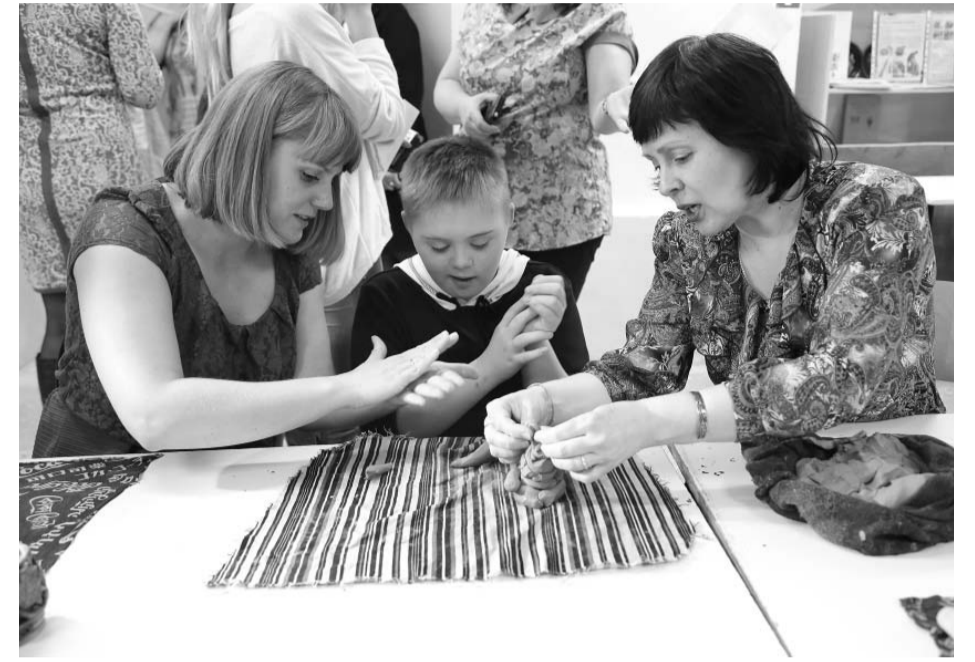
В Иркутском реабилитационном техникуме при поддержке министерства социального развития, опеки и попечительства региона в этом году для детей с нарушениями интеллекта открылись мастерские, где можно научиться вышивке, гончарному делу, бисероплетению

Проекты «Семейная гостиница», «Семейный спорт», «Семейный туризм» – вот далеко не полный пере-