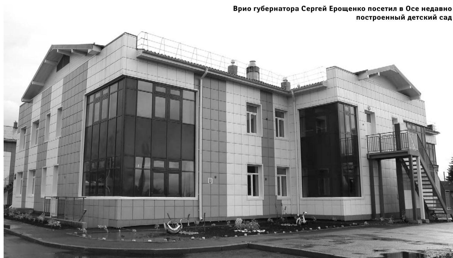
Врио губернатора Сергей Ерошенко посетил в Осе недавно построенный детский сад

Он также рассказал об опыте Обусинской школы, на базе которой преподает-